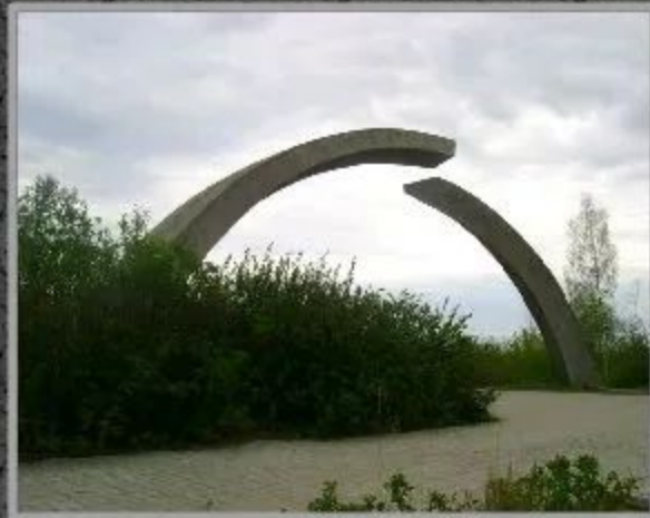
Памятник в честь разрыва блокады Ленинграда.

Блокада Ленинграда стала самой кровопролитной осадой в истории человечества