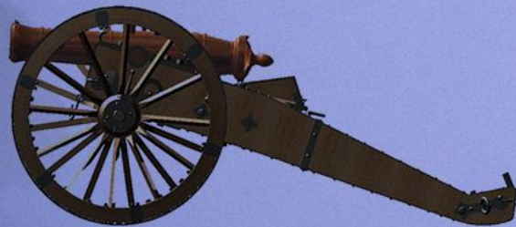
Русский 1/4-пудовый «Единорог»