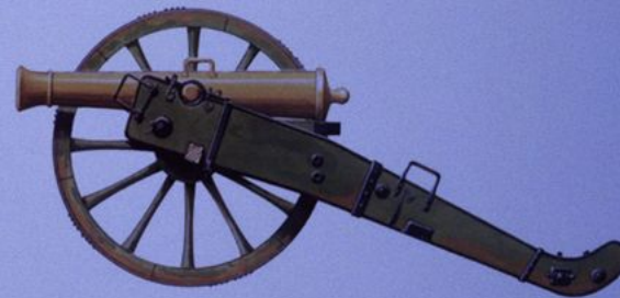
Французская 6-фунтовая пушка малой пропорции