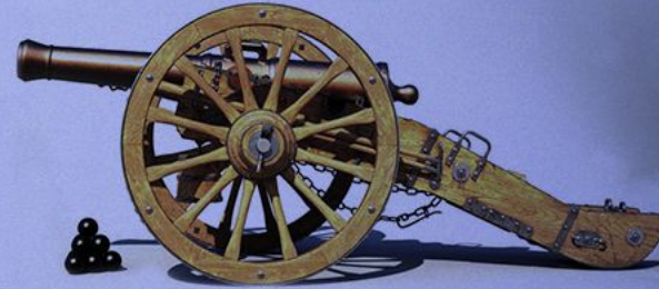
Французская 12-фунтовая пушка системы Грибовала