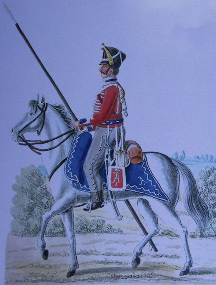
Гусар знаменитой русской кавалерии