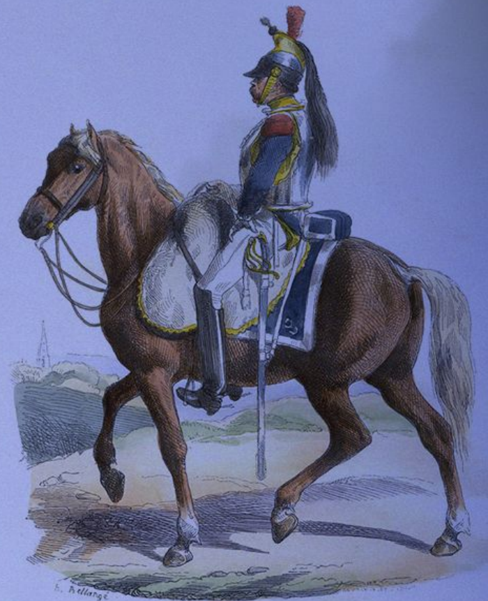
Легковооруженный всадник французской армии