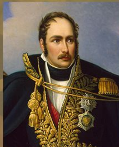
Эжен де Богарне

Вице-король Италии, дивизионный генерал, командир 4-го армейского корпуса Великой армии