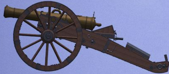
Русская 12-фунтовая пушка малой пропорции