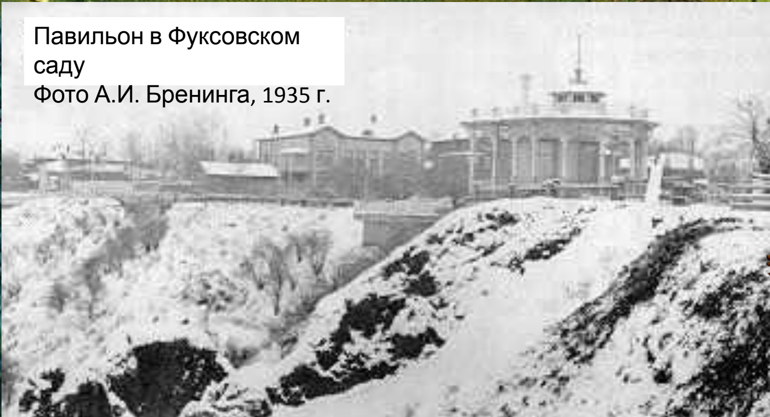
1935 г.