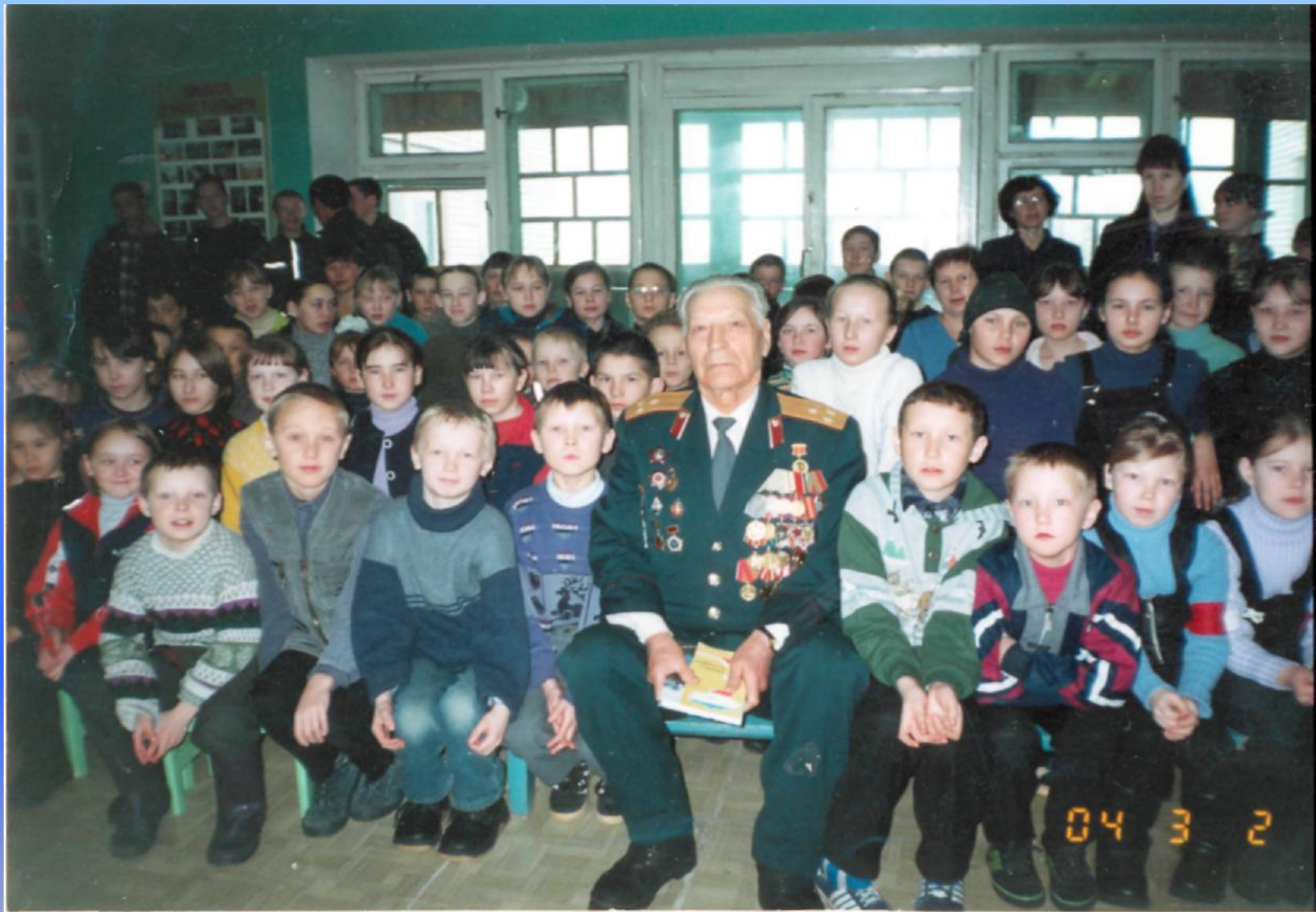
Среди учащихся Купсолинской школы, 2004 год.