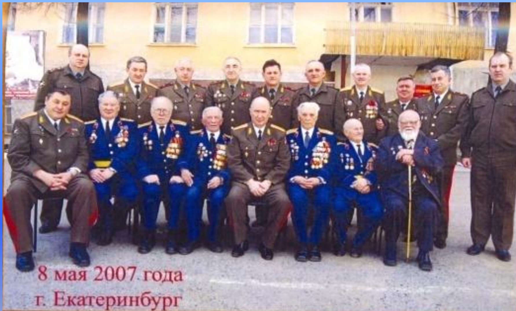
8 мая 2007. года г. Екатеринбург