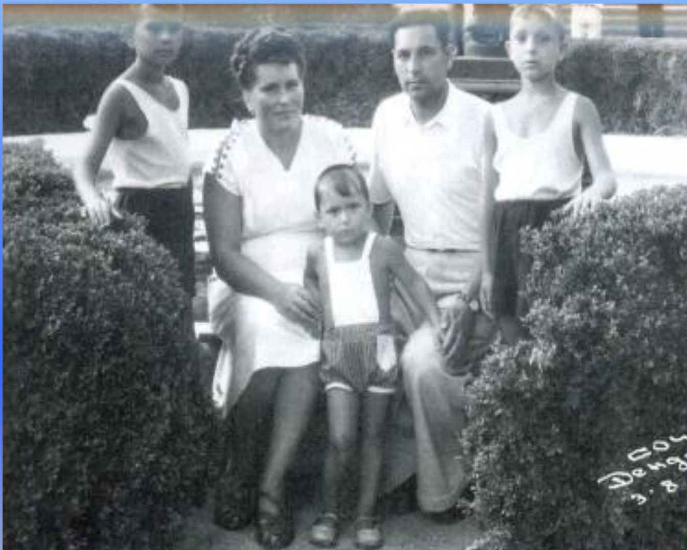
На отдыхе в г. Сочи, 1956 год