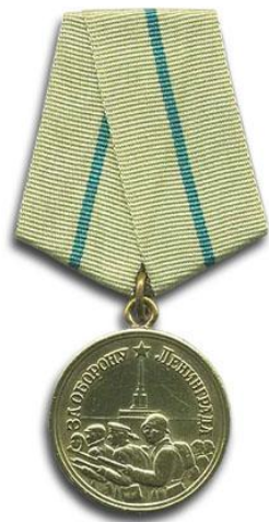
медаль «За оборону Ленинграда»