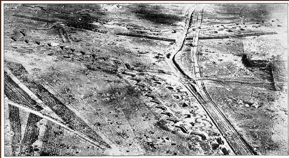
Русский Легион Чести первым прорвал линию Гинденбурга