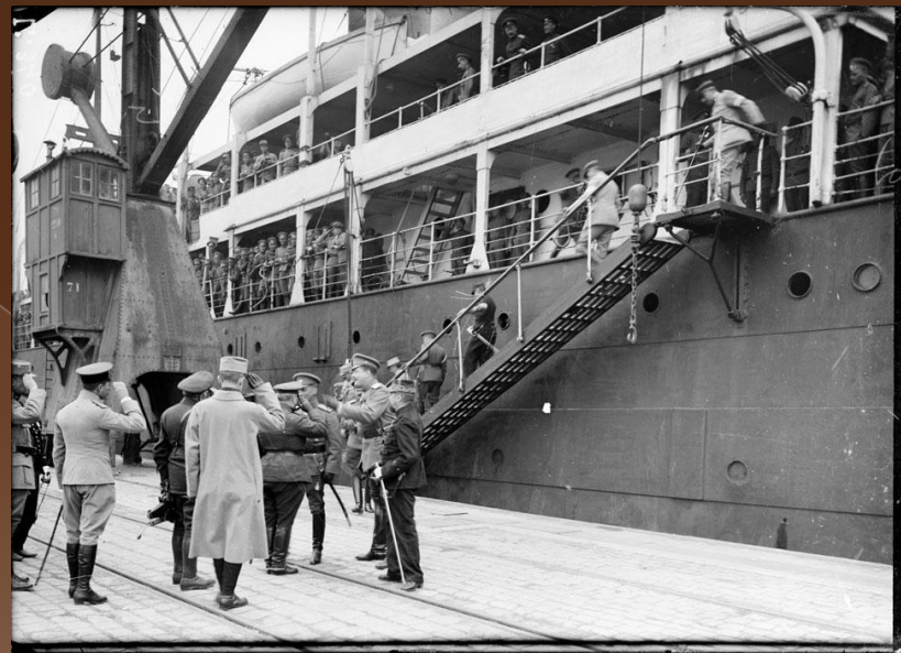
Высадка солдат с "Латуш- Тревилль"