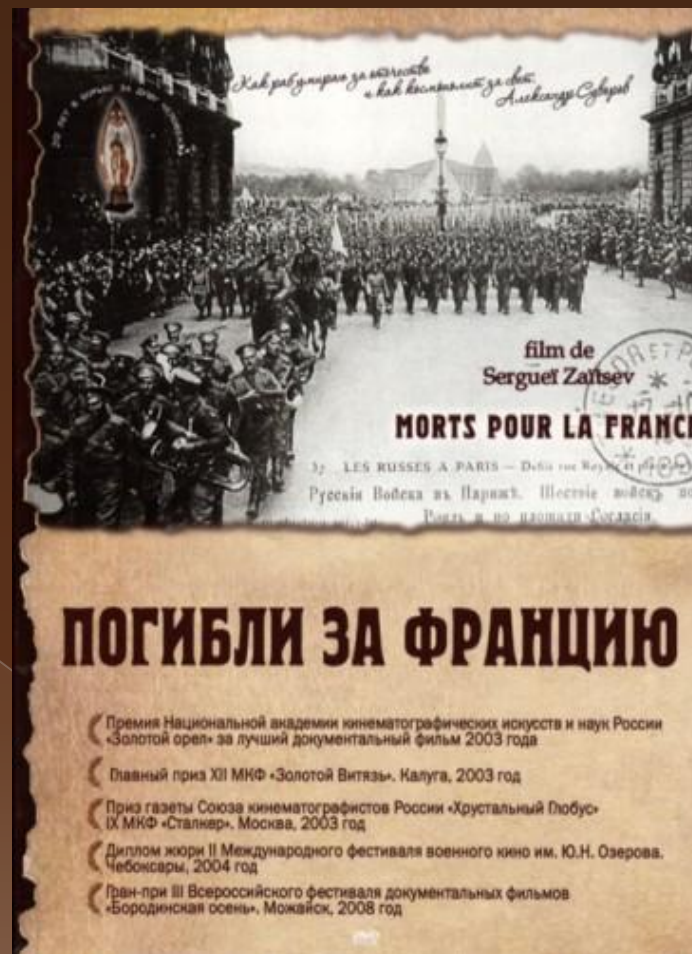
Русский режиссер Сергей Зайцев