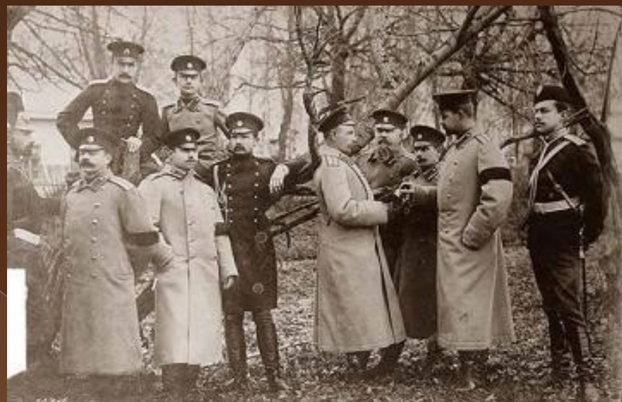
Офицеры. Первые дни во Франции