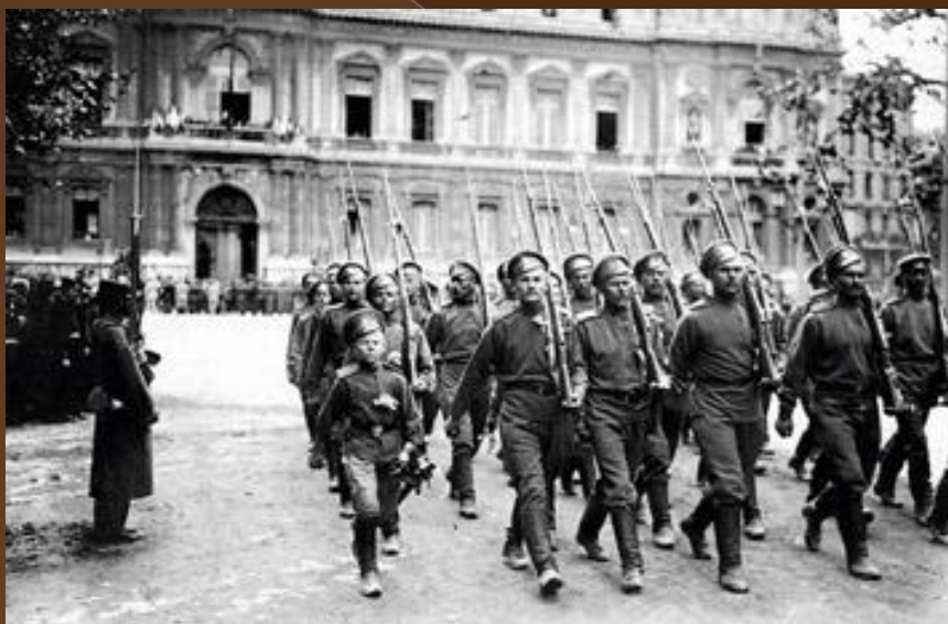
Первые шаги по французской земле