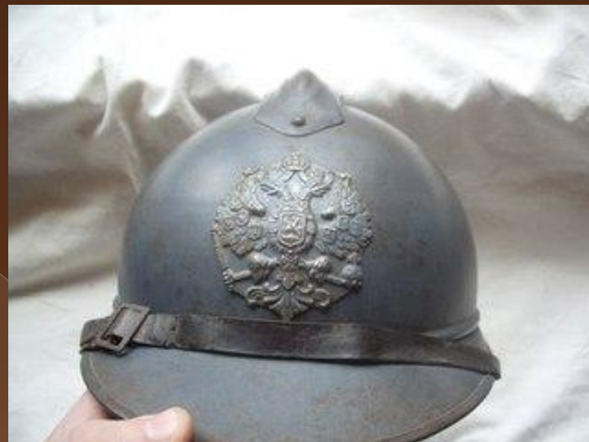
Шлем Русского легионера