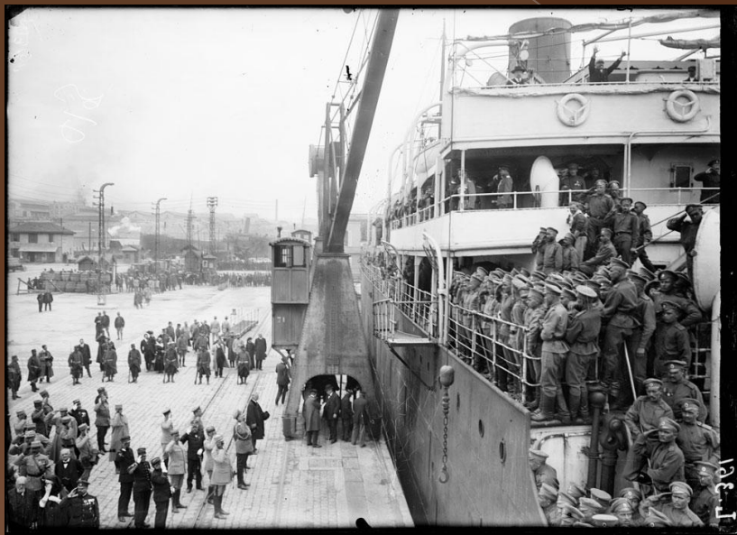
Лагерь Мирабо и Марсель. Апрель 1916 "Латуш-Тревилль", флагман Русского экспедиционного корпуса прибыл в Марсельский порт