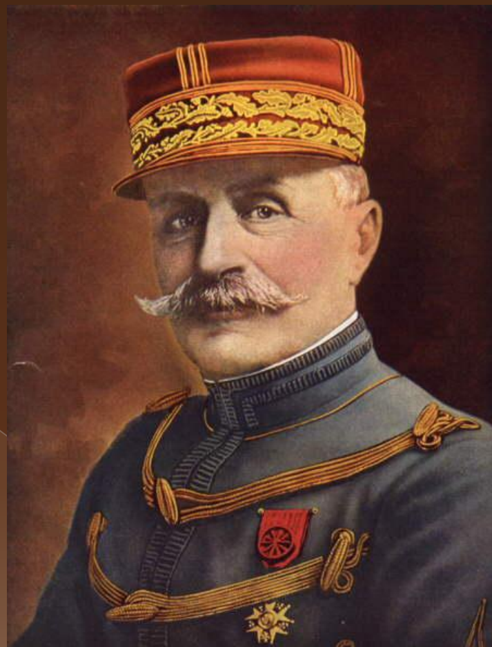
Главнокомандующий Союзными Армиями, Маршал Фердинанд Фош

«Если Франция не была стерта с карты Европы, она этим обязана, прежде всего, России»