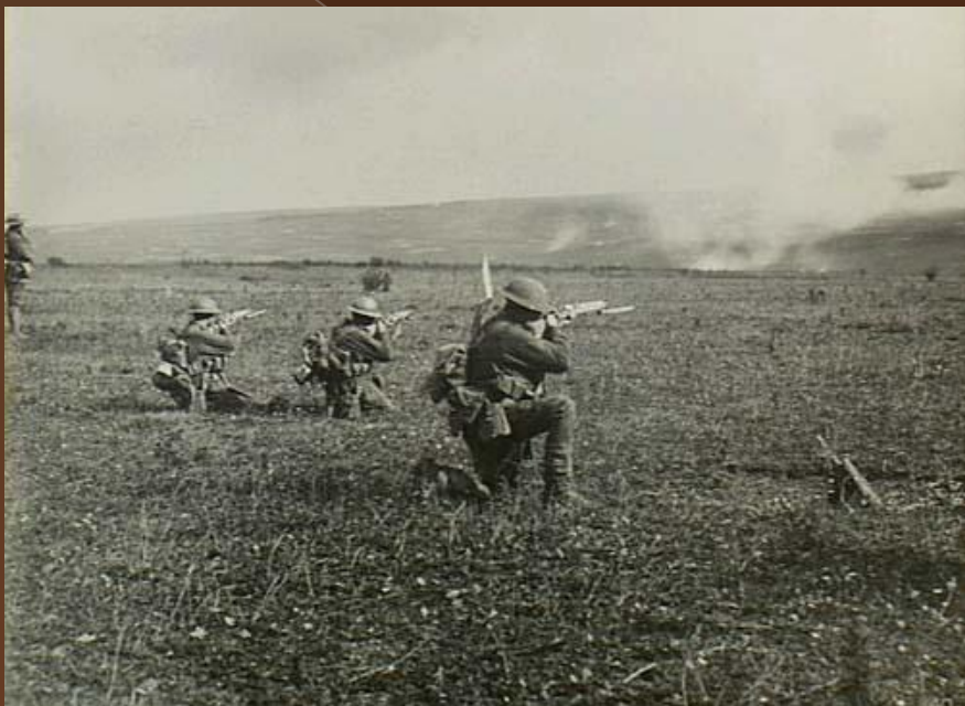
Воины 45-го батальона 4-й армии в наступлении на линию Гинденбурга