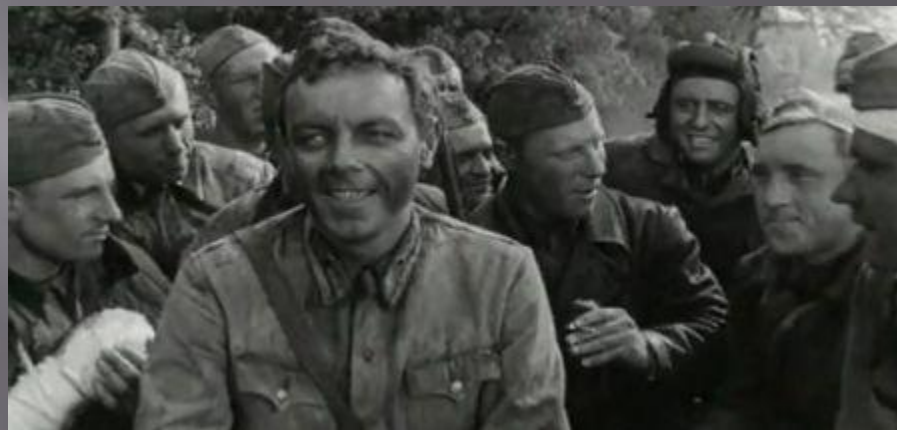
Весёлый солдат «Живые и мёртвые» 1963