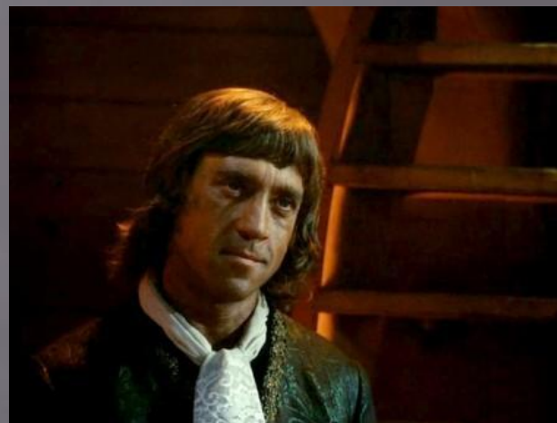
Ибрагим Ганнибал — главная роль «Сказ про то, как царь Пётр арапа женил» 1976

Самую значительную роль Владимир Высоцкий сыграл в 1979 году. Это был Глеб Жеглов в сериале «Место встречи изменить нельзя». Это была и самая любимая роль актёра.