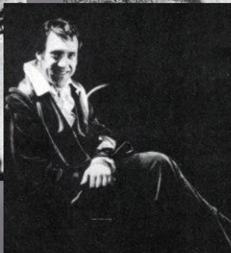
ПРЕСТУПЛЕНИЕ И НАКАЗАНИЕ. Ф. Достоевский. 1979. Свидригайлов.