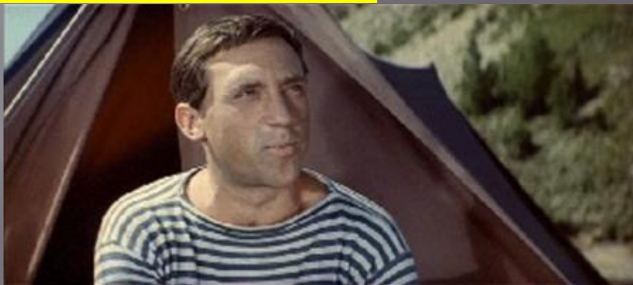
Иван Рябой «Хозяин тайги» 1968