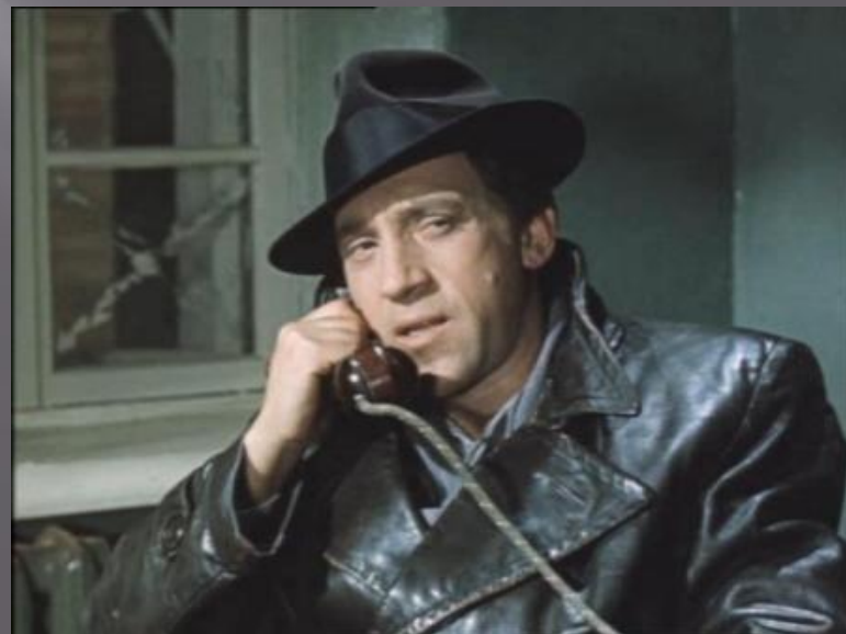
Глеб Егорович Жеглов — главная роль «Место встречи изменить нельзя» 1979

Самую значительную роль Владимир Высоцкий сыграл в 1979 году. Это был Глеб Жеглов в сериале «Место встречи изменить нельзя». Это была и самая любимая роль актёра.