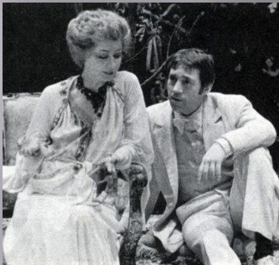
ВИШНЕВЫЙ САД. А. Чехов. 1976. Лопухин.