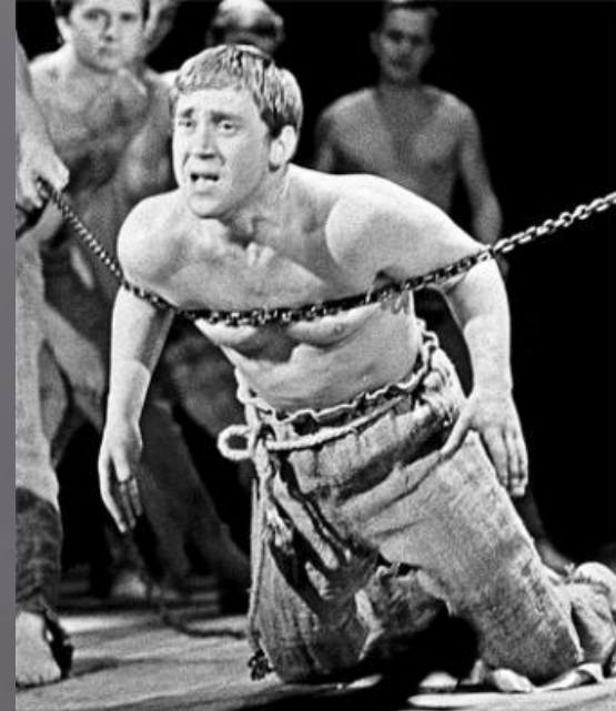
ПУГАЧЕВ. С. Есенин. 1967. Хлопуша.