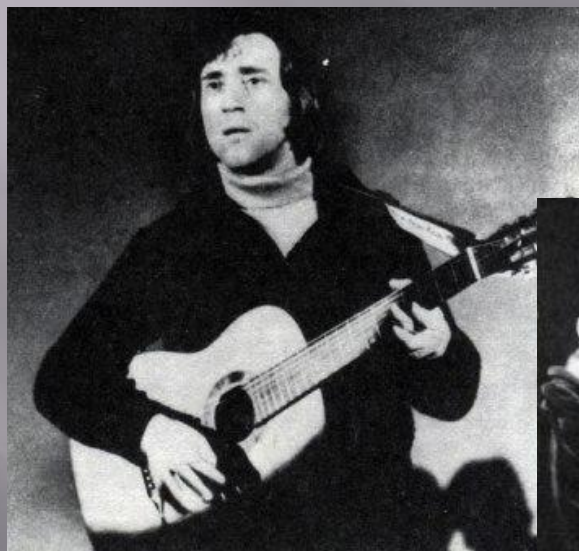
АНТИМИРЫ. А. Вознесенский. 1965