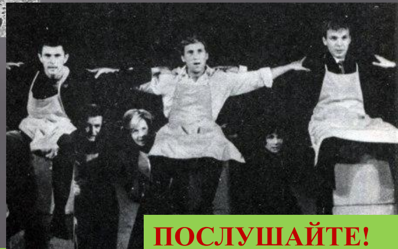
ПОСЛУШАЙТЕ! В. Маяковский. 1967