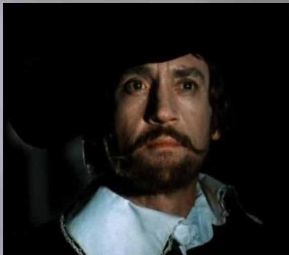
Дон Гуан «Маленькие трагедии» 1979