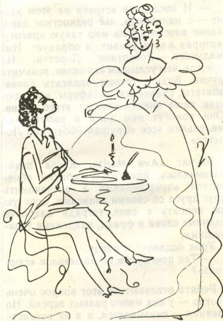
Юный поэт и дама его мечты. Акварель. 1967.