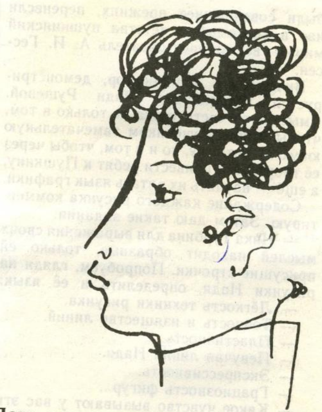
Поэт в возрасте шестнадцати лет. Тушь, перо. 1968.