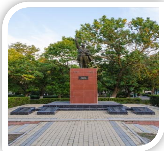
* Переход через Сиваш