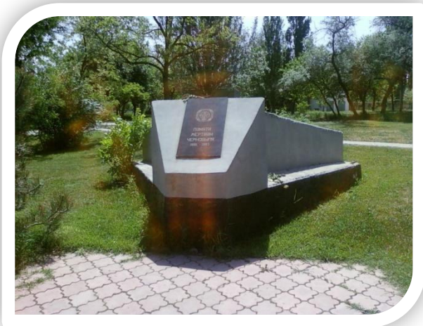
Памяти жертвам Чернобыля