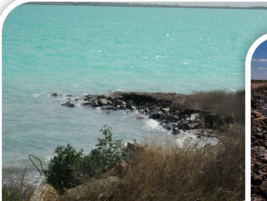
* Озеро Старое