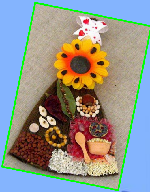
Веник - "ДОМОВУШКА"