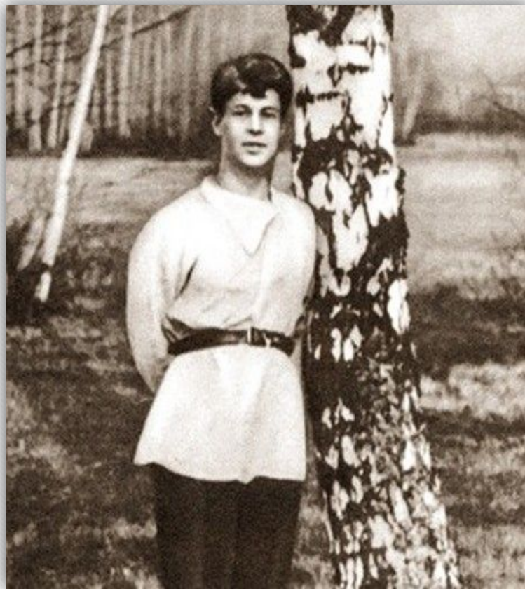
Есенину — семнадцать.

Матушка в купальницу по лесу ходила, Босая, с подтыками, по росе бродила. Травы ворожбинье ноги ей кололи, Плакала родимая в кудрях от боли.