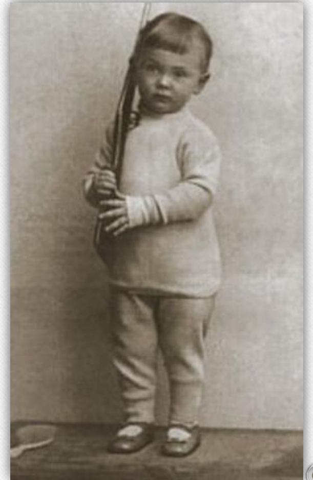
Сергей Есенин в детстве