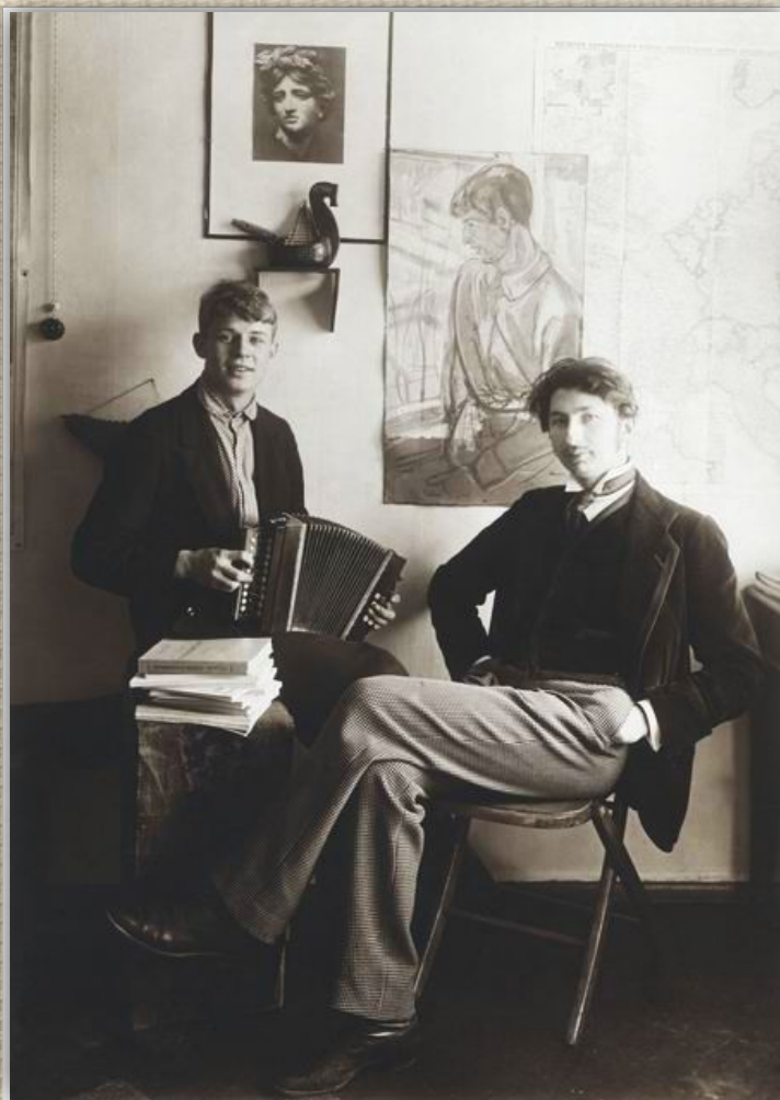
СЕРГЕЙ ЕСЕНИН с поэтом Сергеем Городецким. Петроград 1915 г

Покинув родное село Константиново и, обосновавшись в Москве, Сергей Есенин постоянно мыслями возвращается в отчий дом. Сергей постоянно помогал родителям, «получив деньги, обычно шел на почту и отправлял большую часть матери в Константиново». Он вспоминал о своей малой Родине и о своей матери в те моменты, когда на душе было особенно тоскливо.