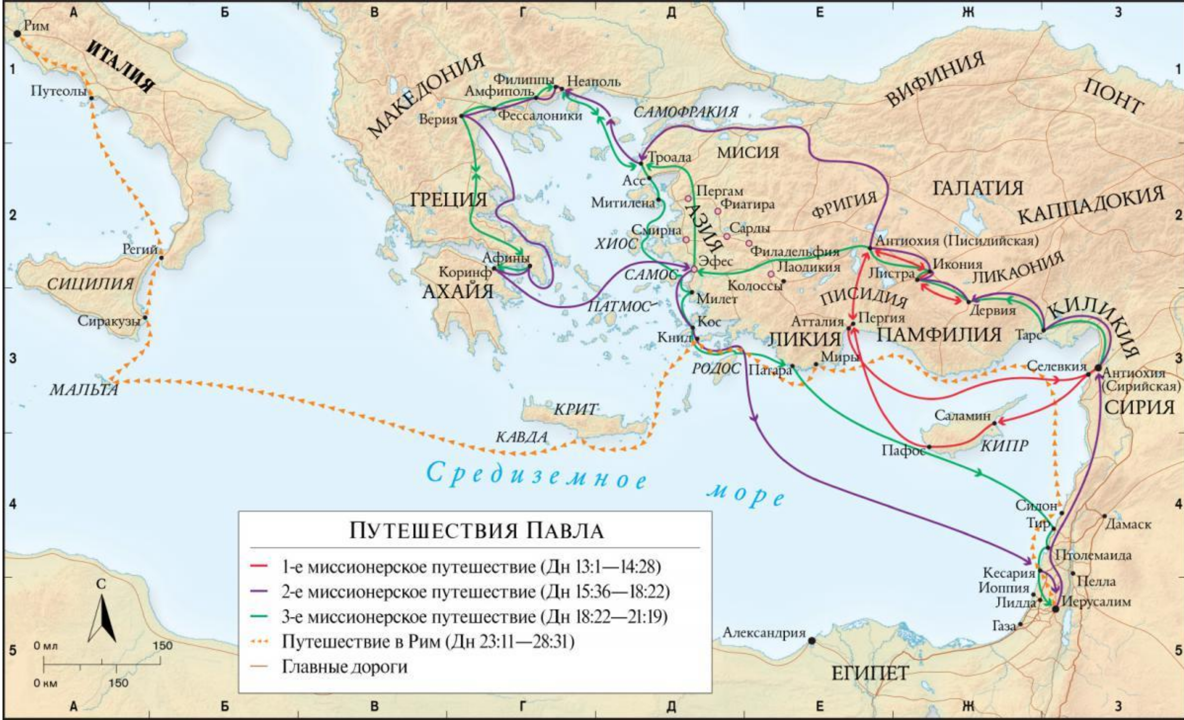
ПУТЕШЕСТВИЯ ПАВЛА — 1-е миссионерское путешествие (Дн 13:1—14:28) — 2-е миссионерское путешествие (Дн 15:36—18:22) — 3-е миссионерское путешествие (Дн 18:22—21:19) - - - Путешествие в Рим (Дн 23:11—28:31) — Главные дороги