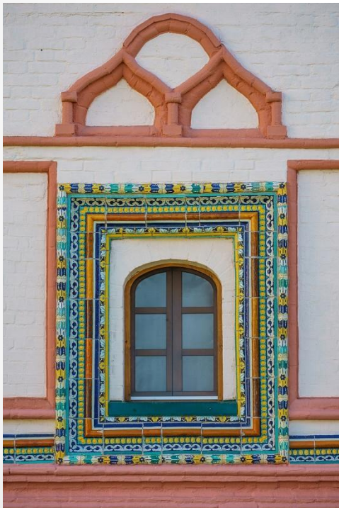
Украшенный поливной глазурью наличник (Россия, XVII век)

В технике майолики изготавливаются как декоративные панно, наличники, изразцы и т. п., так и посуда и даже монументальные скульптурные изображения.