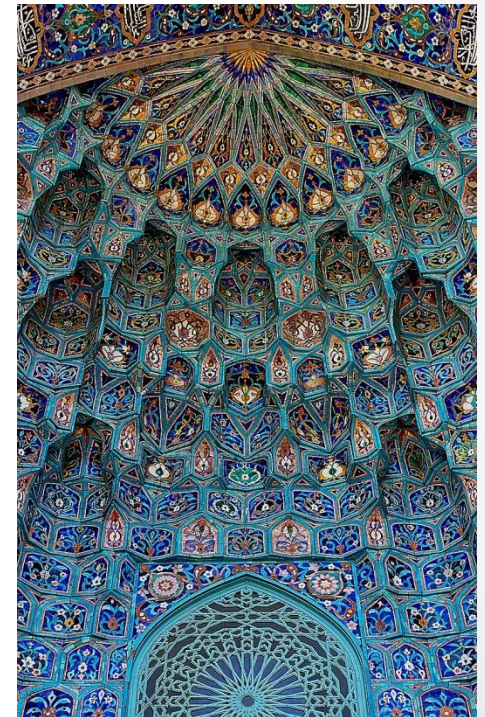
Майолика Санкт-Петербургской соборной мечети