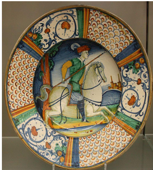
Итальянская майолика эпохи Возрождения