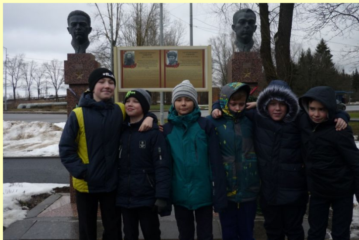
Автобусная экскурсия по историческим местам города