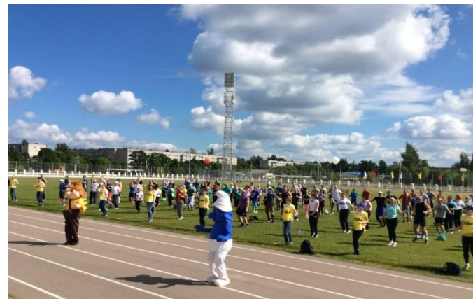
Стадион и футбольное поле