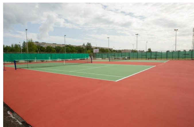
Открытые теннисные корты