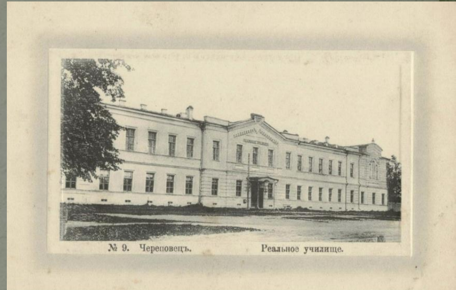
№ 9. Череповецъ.