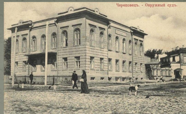
Череповец. - Окружной судъ.