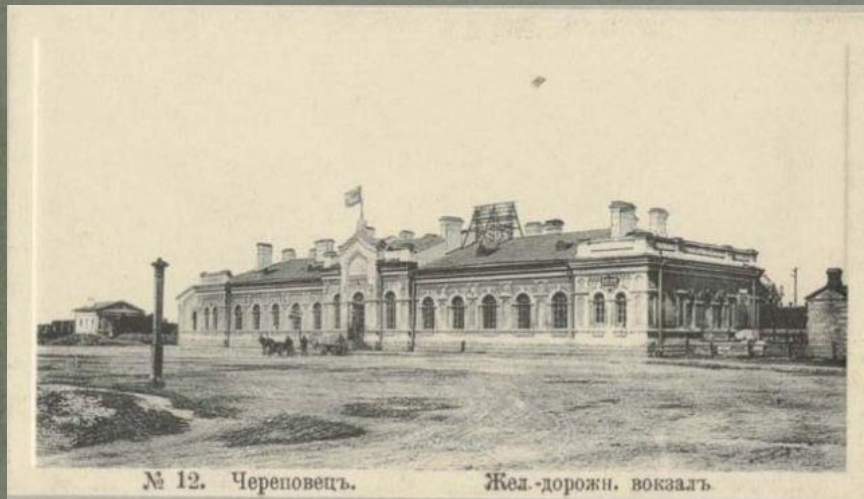
№ 12. Череповецъ. Жел.-дорожн. вокзалъ.