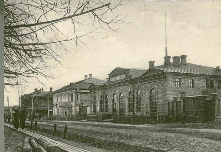
Г. Череповец. Кинематограф.