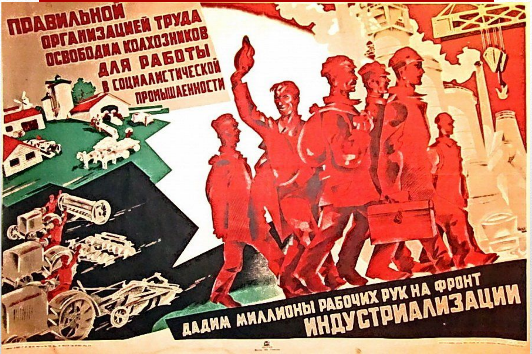
Подготовка к индустриализации (1925-1928 годы)