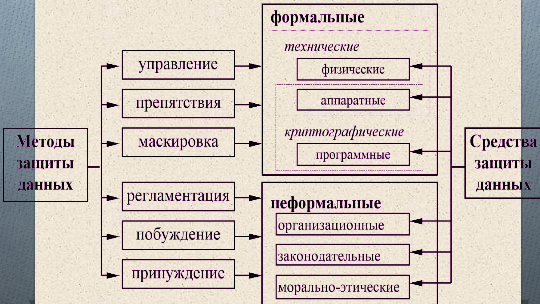
Табл. 1 Методы защиты информации