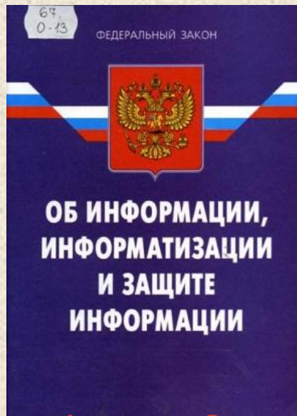
Рис.1 Закон Российской Федерации №149-ФЗ «Об информации, информационных технологиях и защите информации»