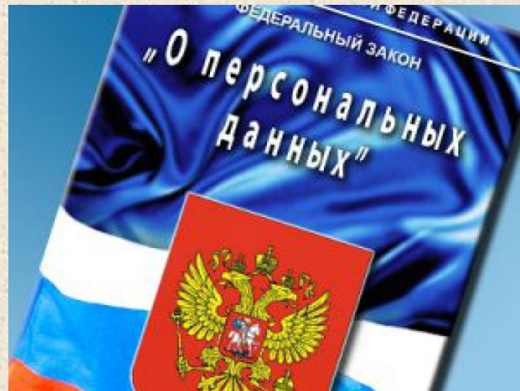
Рис.2 Закон №152-ФЗ «О персональных данных»