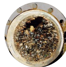
Пример обрастания водозаборной трубы на одной из нефтяных платформ

Такие дефекты как «наружные трещины в элементах конструкции», «наличие поврежденных элементов», «участки активной коррозии», «участки с поврежденным лакокрасочным покрытием» обнаружить очень сложно или фактически невозможно, так как они скрыты под сплошным слоем биомассы. Обрастание отрицательно влияет на проходимость водозаборных трубопроводов, функционирование и диагностику катодной защиты объектов.