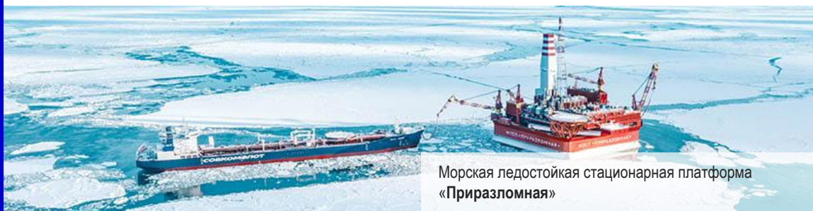
Морская ледостойкая стационарная платформа «Приразломная»