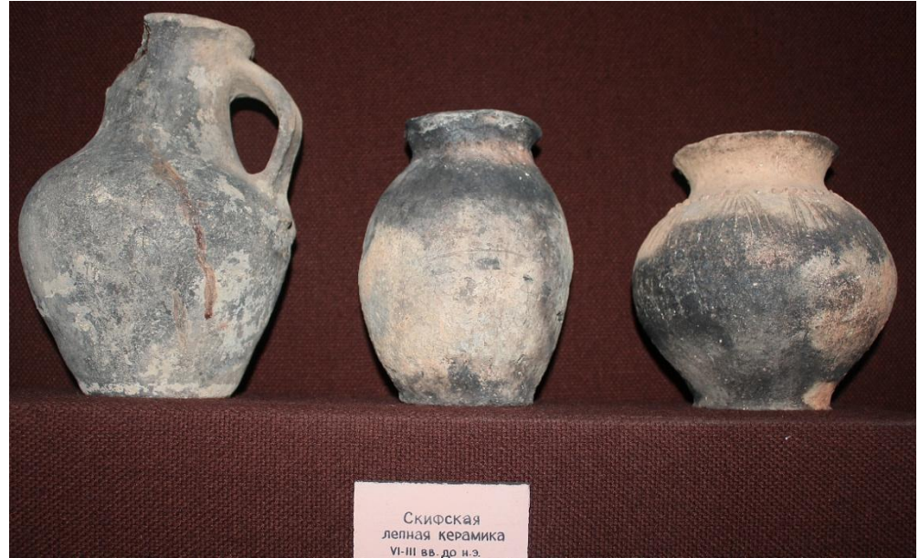
Скифская лепная керамика VI-III вв. до н.э.