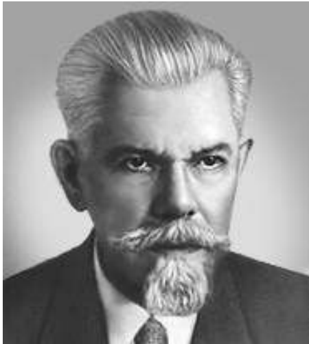
Ожегов Сергей Иванович