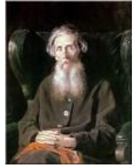
Даль Владимир Иванович