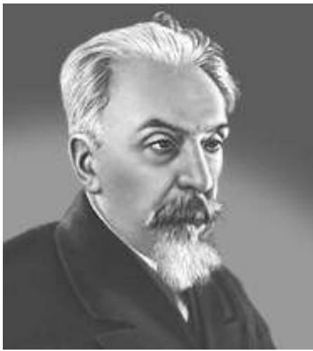
Щерба Лев Владимирович