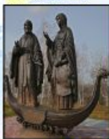
Памятник в Жайску