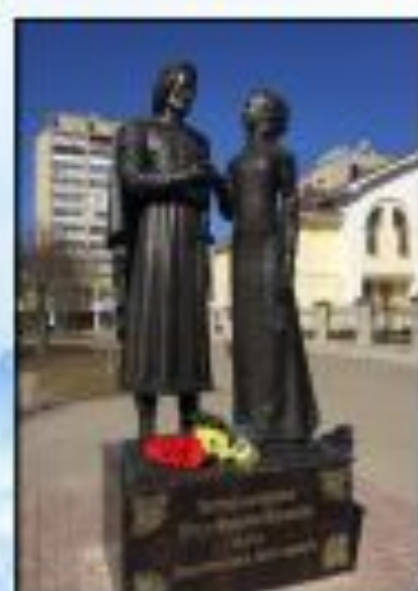
Памятник в Обнинске