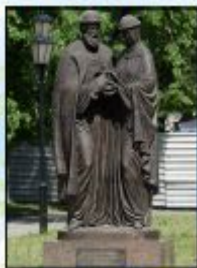
Памятник в Ярославле