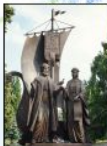
Памятник в Самаре