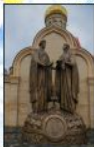
Памятник в Калени