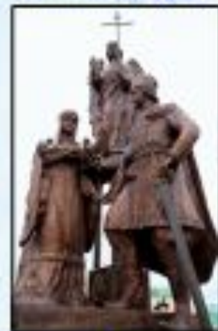
Памятник в Чобокерях