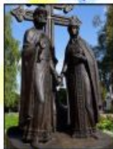
Памятник в Великом Новгороде