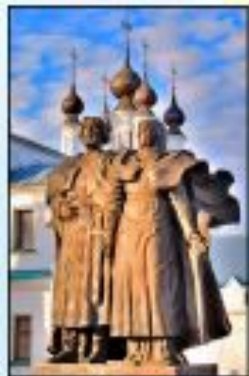
Памятник в Муроме

Памятники Святым Петру и Февронии установлены уже в более 60-ти городах России.