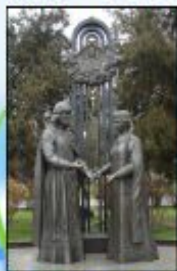
Памятник в Ростове-на-Дону