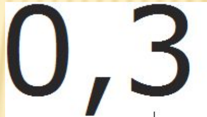
ноль целых три десятых