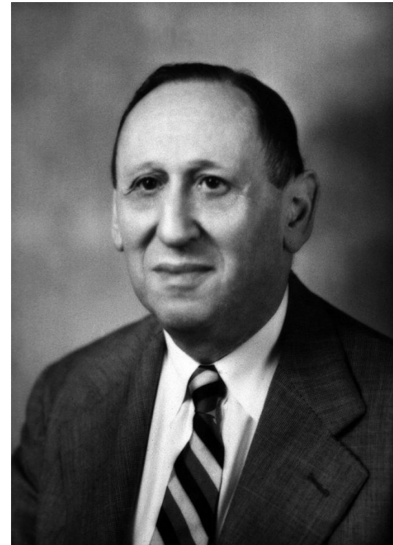
Лео Каннер - Австрийский и американский психиатр

По «усредненной» статистике, заболеваемость синдромом Каннера составляет 2–4 случая на каждые 10 тысяч детей. При этом у мальчиков данное состояние встречается втрое чаще, чем у девочек.