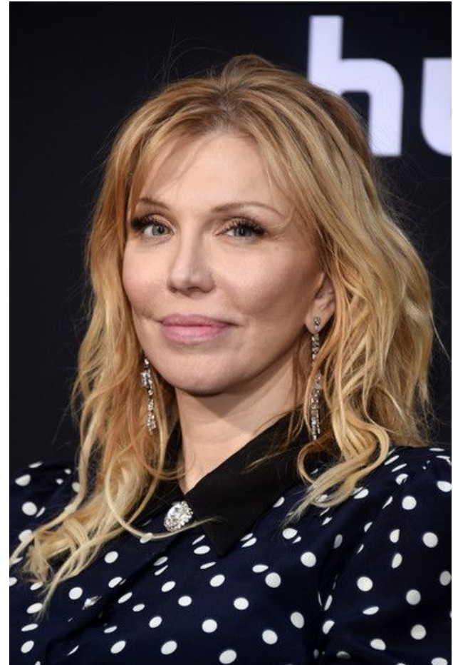
Кортни Лав, американская актриса, рок-певица

Прогноз о будущем состоянии больного может сделать лишь лечащий врач, наблюдавший ребёнка постоянно. Существует немало случаев, которые демонстрируют, что при качественном лечении синдром Каннера даже в тяжёлой форме заболевания не мешает пациенту развиваться, а слабые признаки болезни эффективно подобранная терапия вообще может сделать почти незаметными.