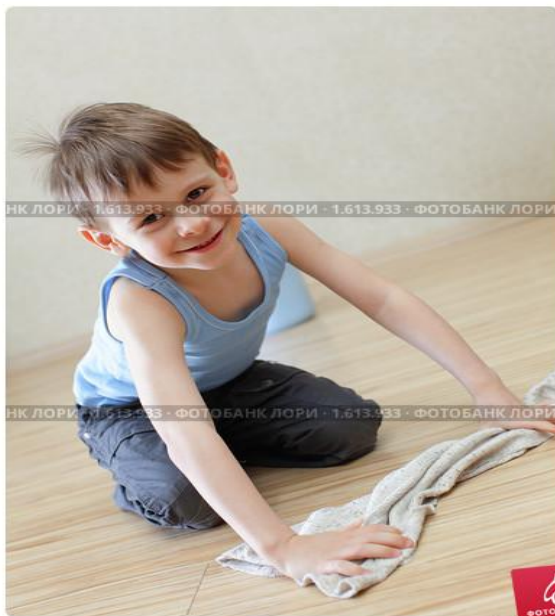
Мальчик моет пол