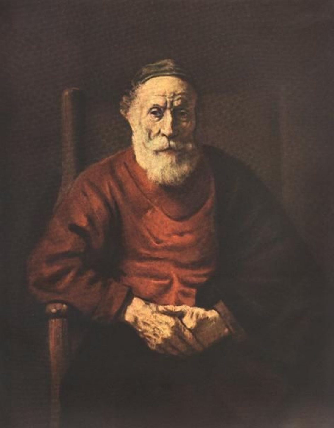
Портрет старика в красном, 1654 Эрмитаж