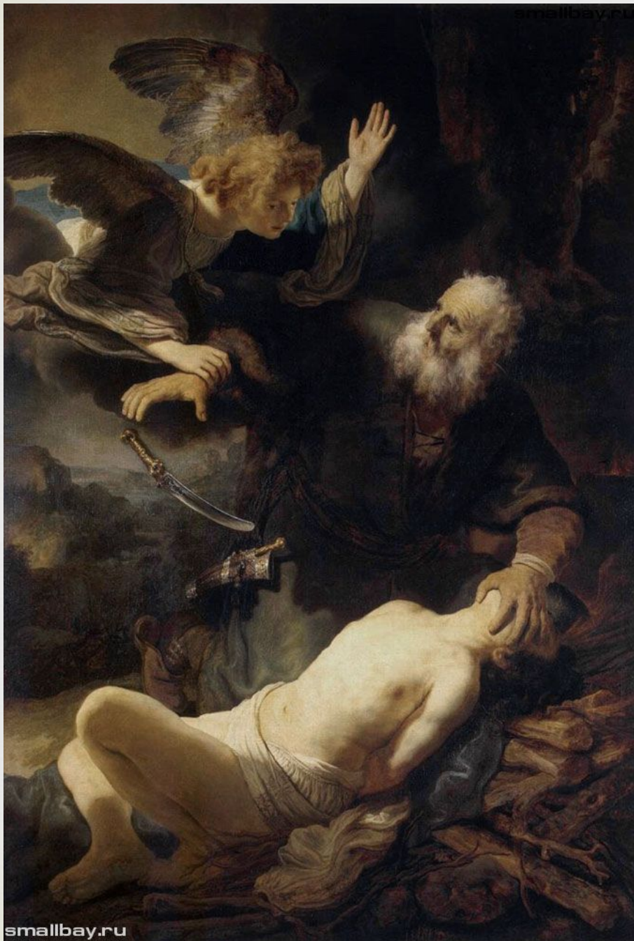
Жертвоприношени е Авраама, 1635