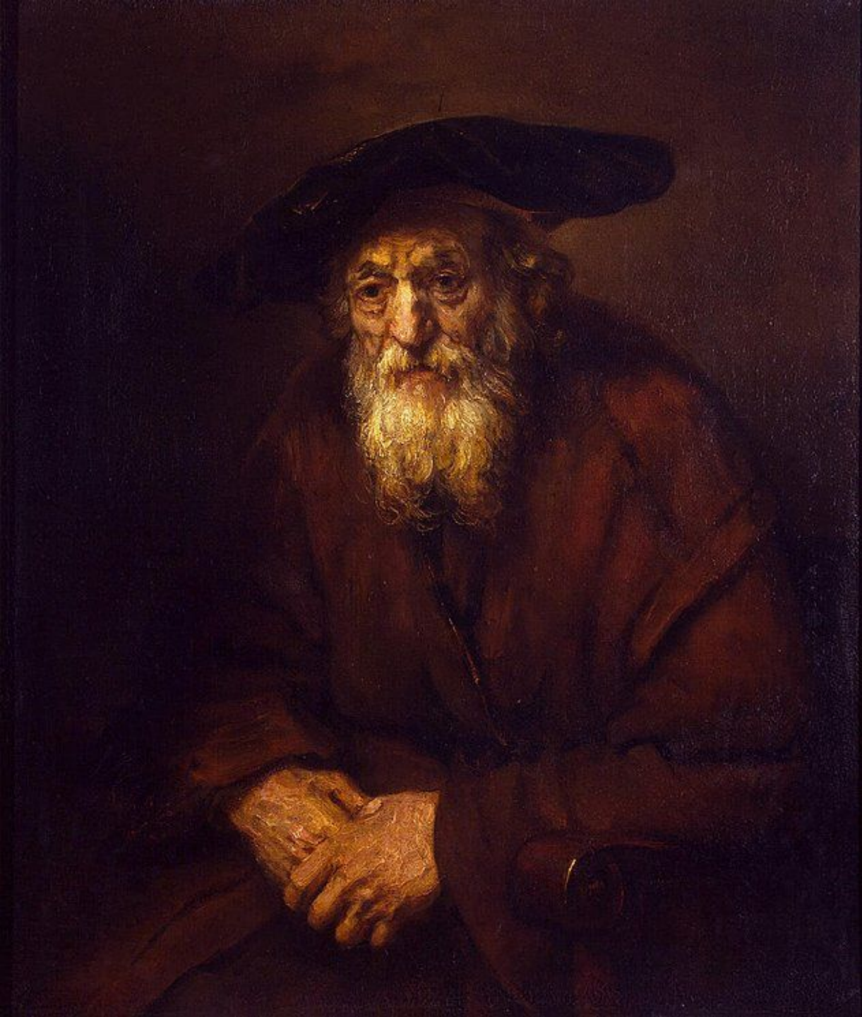
Рембрандт. Портрет старика в кресле