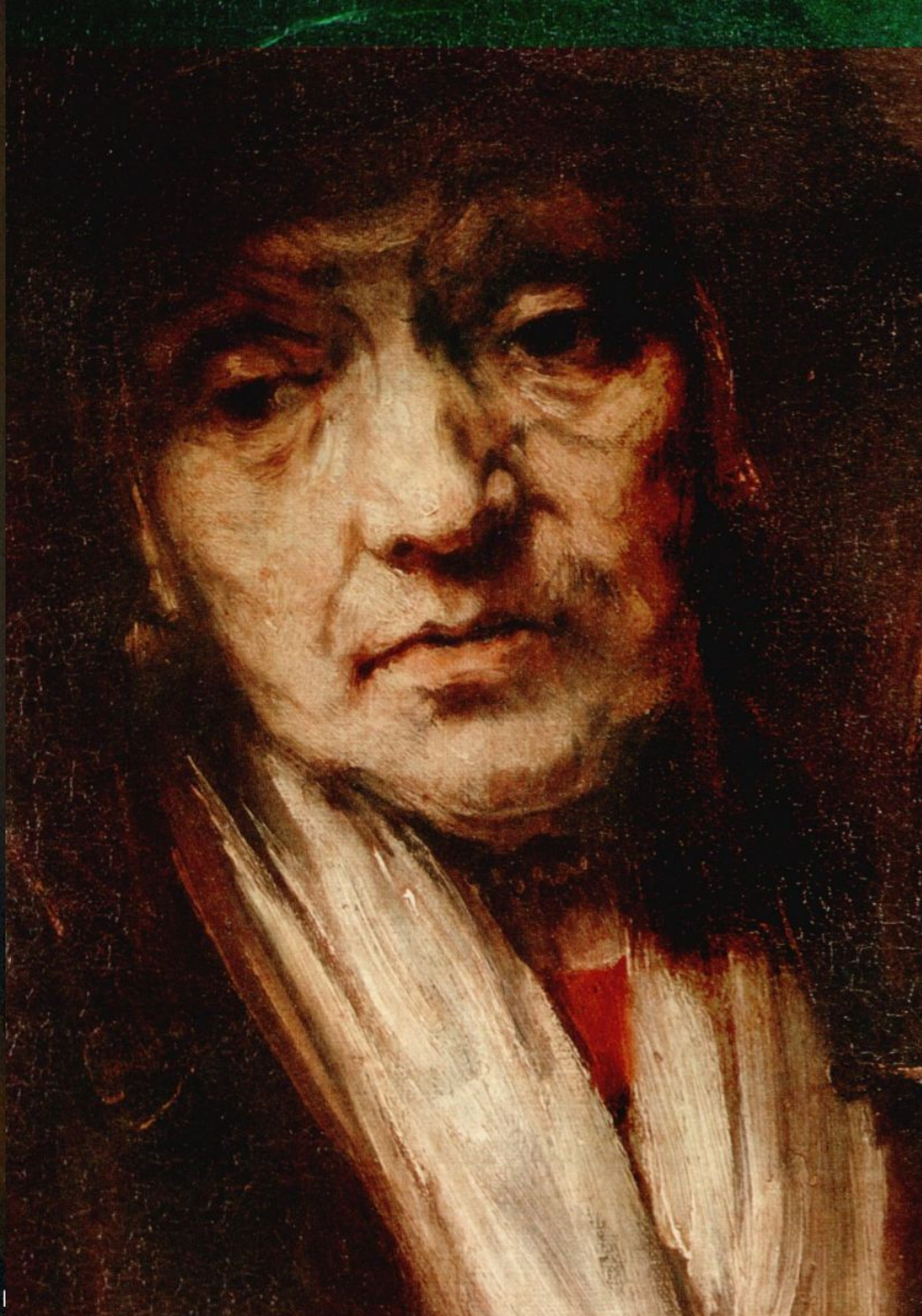
Рембрандт. Портрет старушки