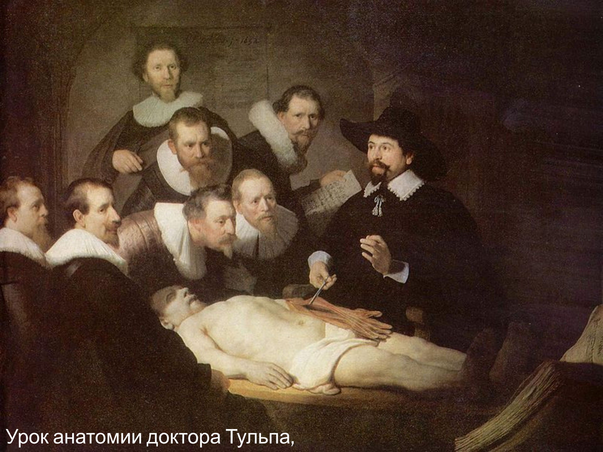
Урок анатомии доктора Тульпа,