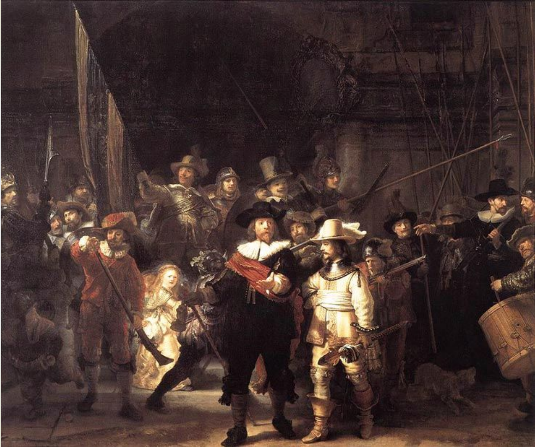
Ночной Дозор, 1642, Амстердам