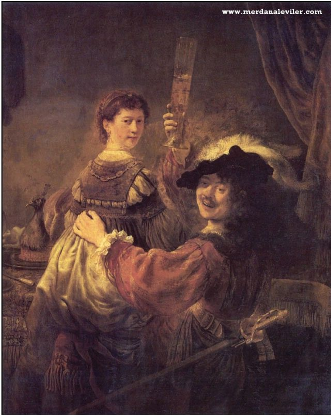
"Автопортрет с Саскией" (1636)