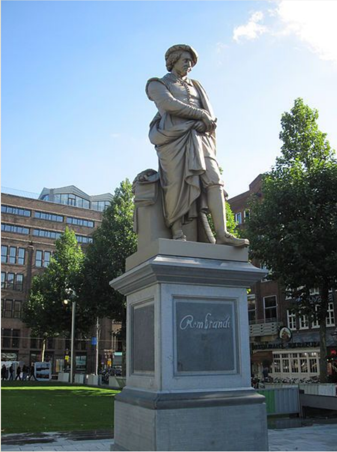
Памятник Рембрандту на площади Рембрандта в Амстердаме