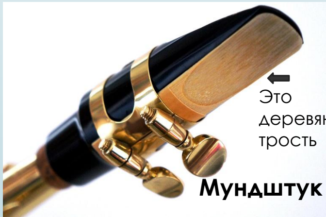
Мундштук и трость саксофона