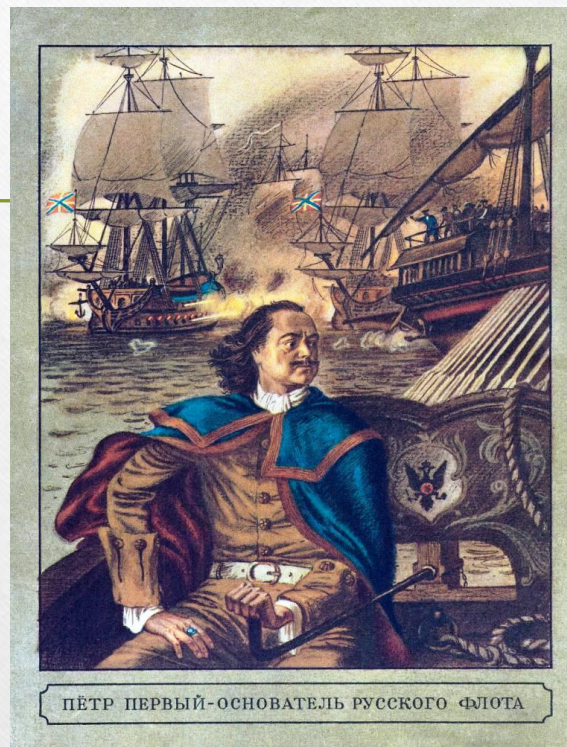
ПЁТР ПЕРВЫЙ-ОСНОВАТЕЛЬ РУССКОГО ФЛОТА

Регулярная армия России Была создана Петром I в начале XVIII века