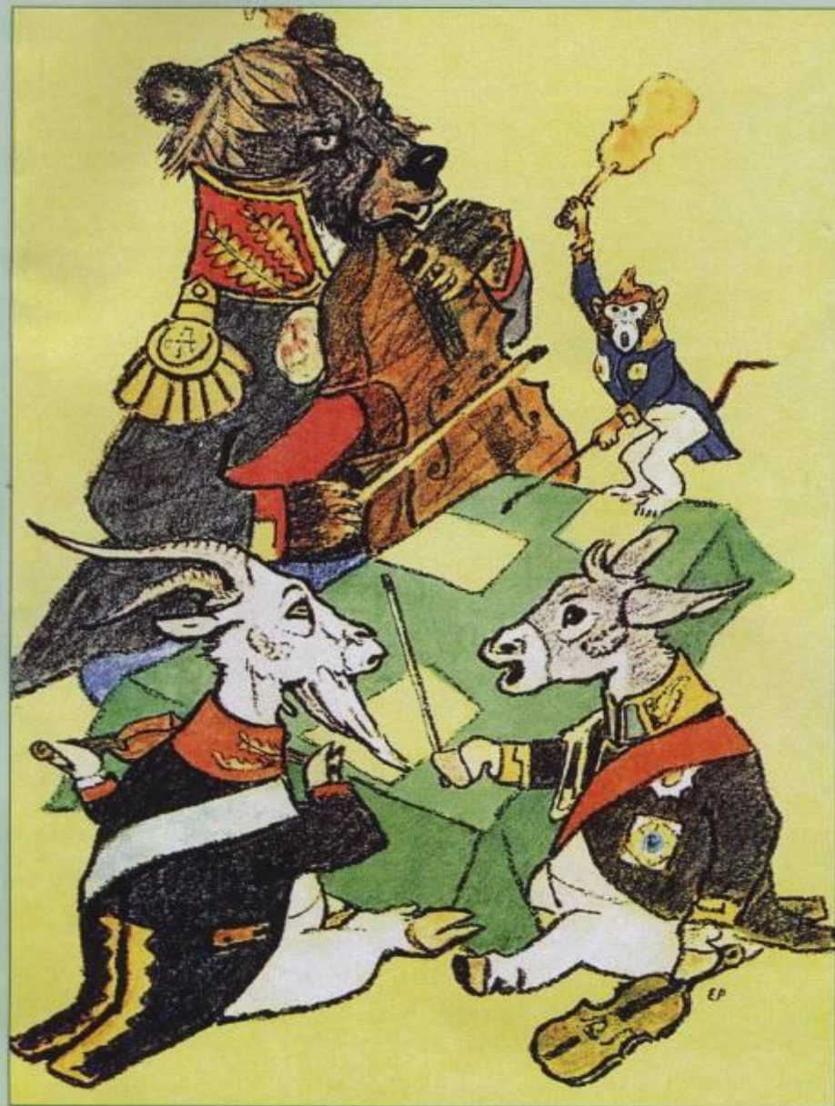
Е. Рачев. Иллюстрация к басне «Квартет»

«Чтоб музыкантом быть, Так надобно уметь И уши ваших понежней,- Им отвечает Соловей, - А вы, друзья, как ни садитесь, Всё в музыканты не годитесь».