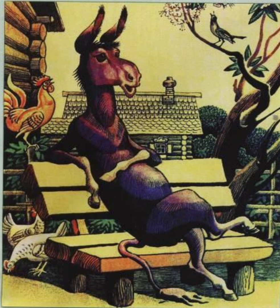
С.Артюшенко. Иллюстрация к басне «Осел и Соловей»