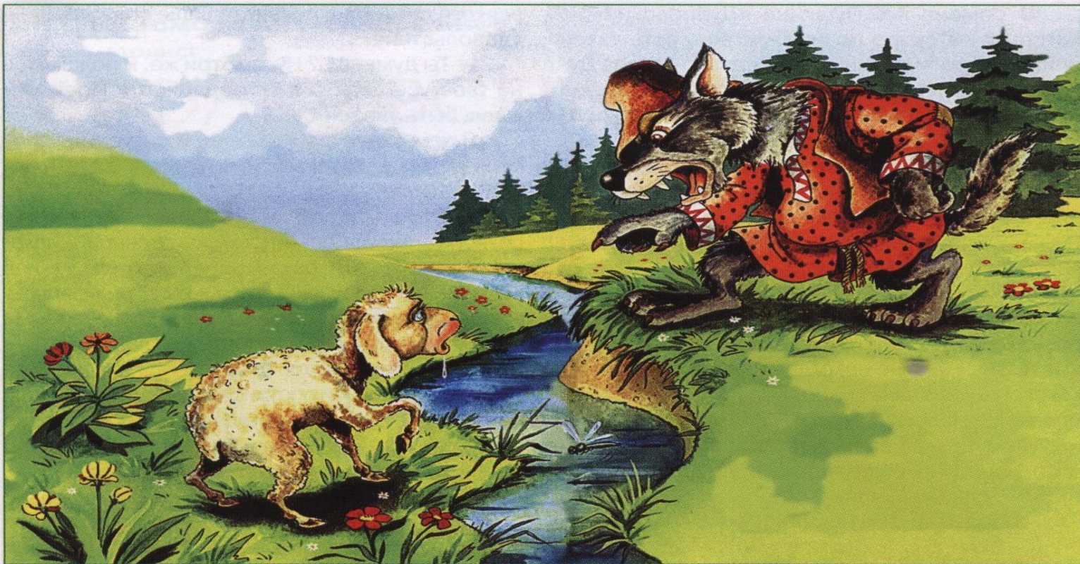
В. Кастальский. Иллюстрация к басне «Волк и Ягненок»

У сильного всегда бессильный виноват: Тому в Истории мы тьму примеров слышим, Но мы Истории не пишем; А вот о том как в баснях говорят.