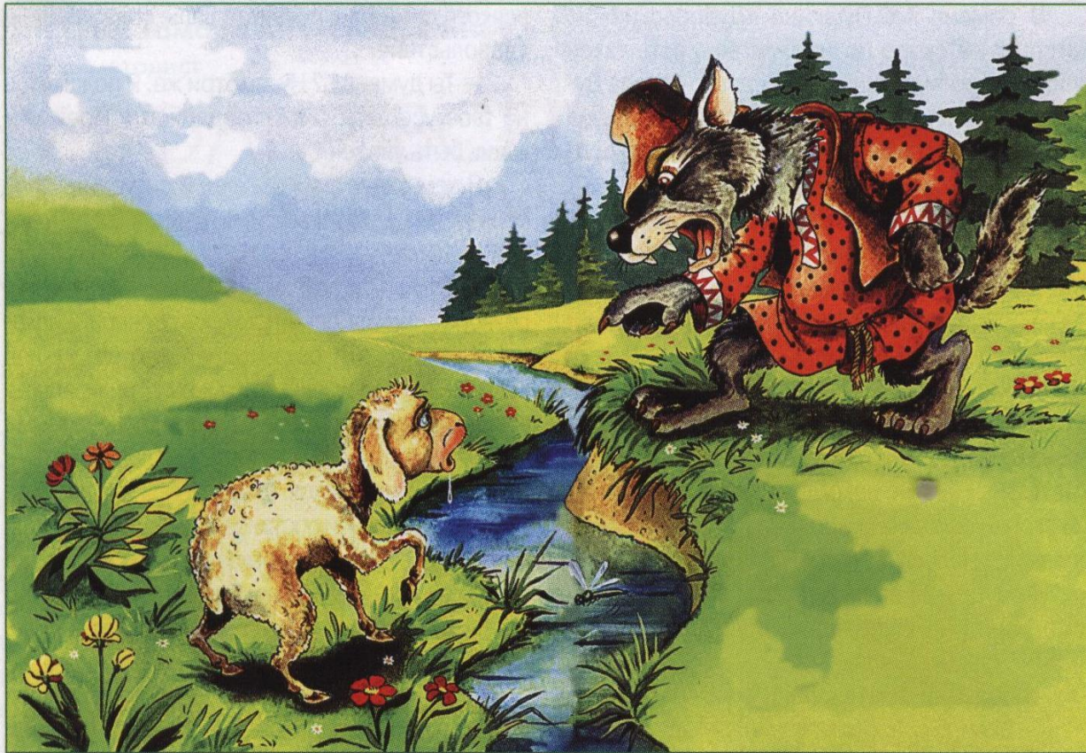
В. Кастальский. Иллюстрация к басне «Волк и Ягненок»

«Как смеешь ты, наглец, нечистым рылом здесь чистое мутить питьё моё с песком и с илом? За дерзость такову я голову с тебя сорву.»