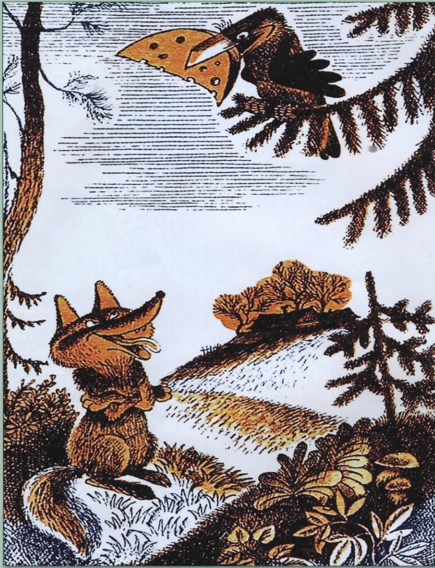
В. Чижиков. Иллюстрация к басне «Ворона и Лисица»

Уж сколько раз твердили миру, Что лезть гнусна, вредна; но только всё не впрок, И в сердце льстец всегда отыщет уголок.