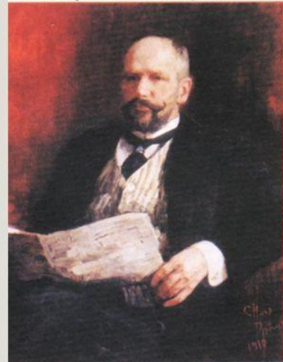
Петр Столыпин (1862—1911)

П.А. Столыпин, из обращения ко второй Думе