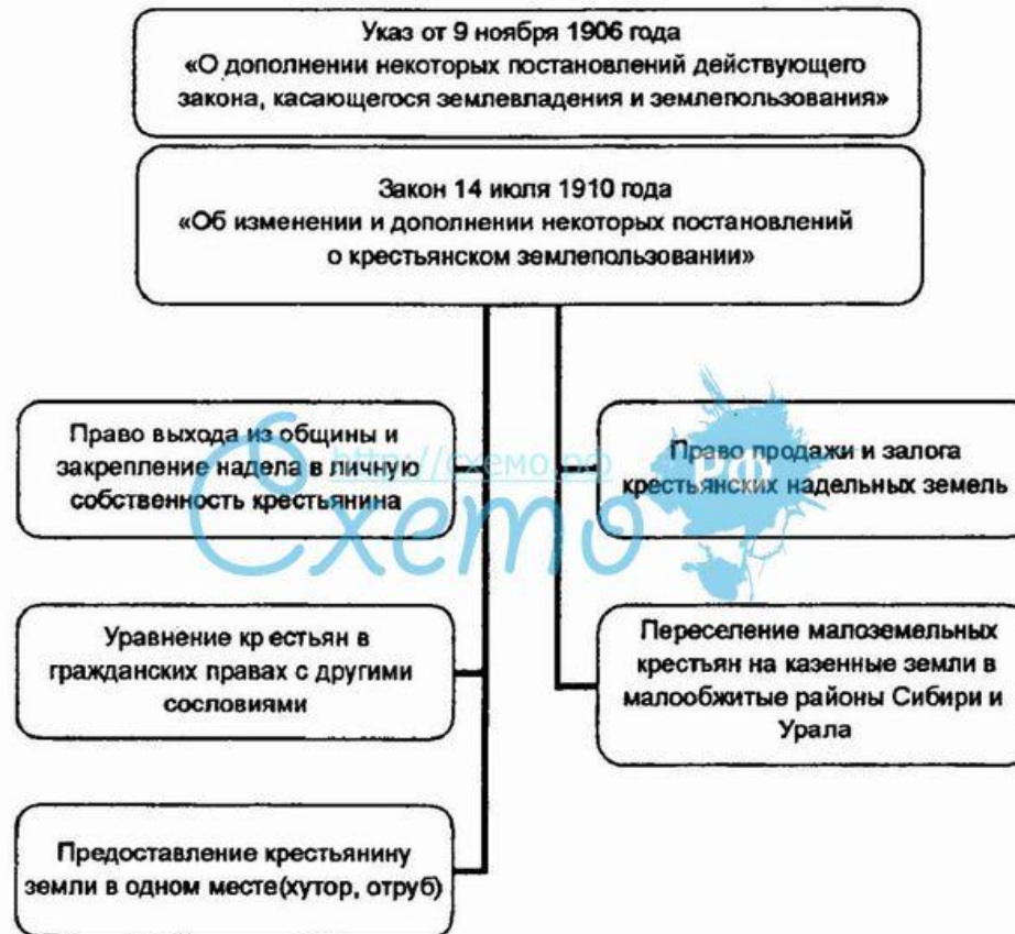
Схема 15. Аграрная реформа П.А. Столыпина (1906–1910 гг.)