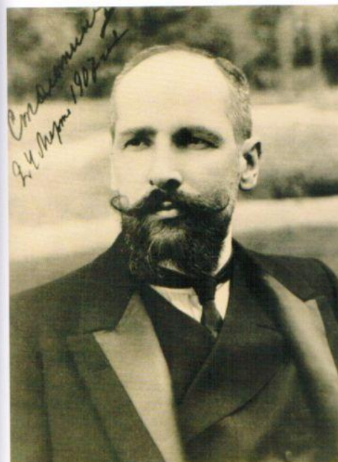
Председатель Совета Министров, Статс-Секретарь П. А. Столыпин.

(под руководством Столыпина был разработан ряд крупных законопроектов, в том числе по реформе местного самоуправления, введению всеобщего начального образования, государственному страхованию рабочих, о веротерпимости)