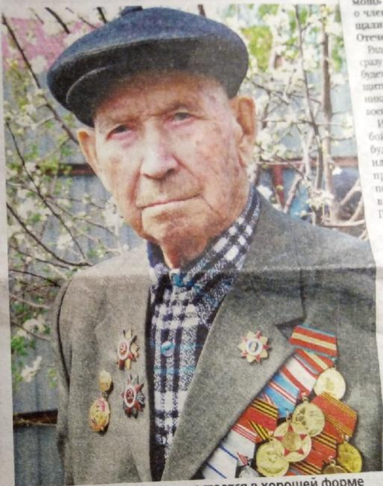
Несмотря на годы, ветеран остается в хорошей форме

шьявка, Сталинградской области, оно оказалось пустым. Все местные жители схоронились в погребах, иначе просто бы сторели заживо.