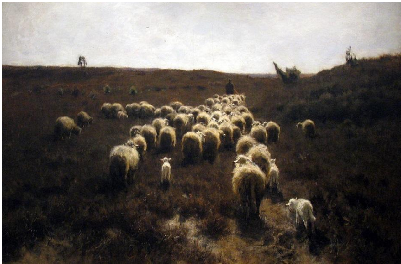
Натурализм. Антон Мауве. «Возвращение отары», 1886-1887