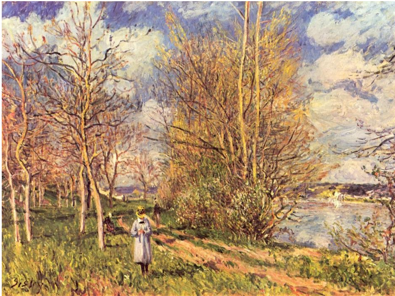
Импрессионизм. Альфред Сислей. «Лужайки весной»