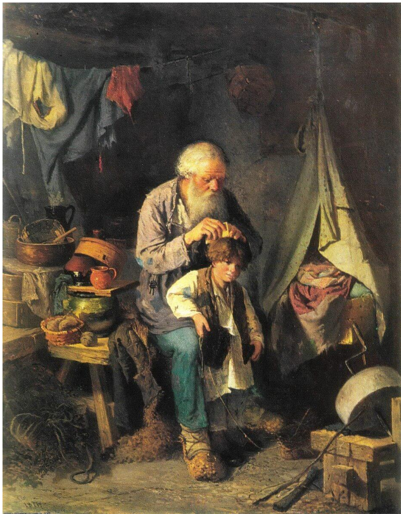
Дедушка и внучек. Василий Перов. 1871 год. Холст, масло