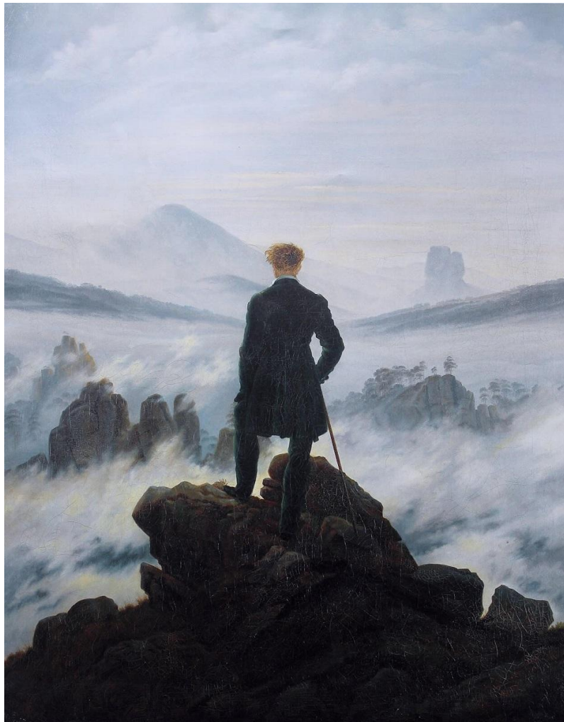
Романтизм. Каспар Давид Фридрих. «Странник над морем тумана»