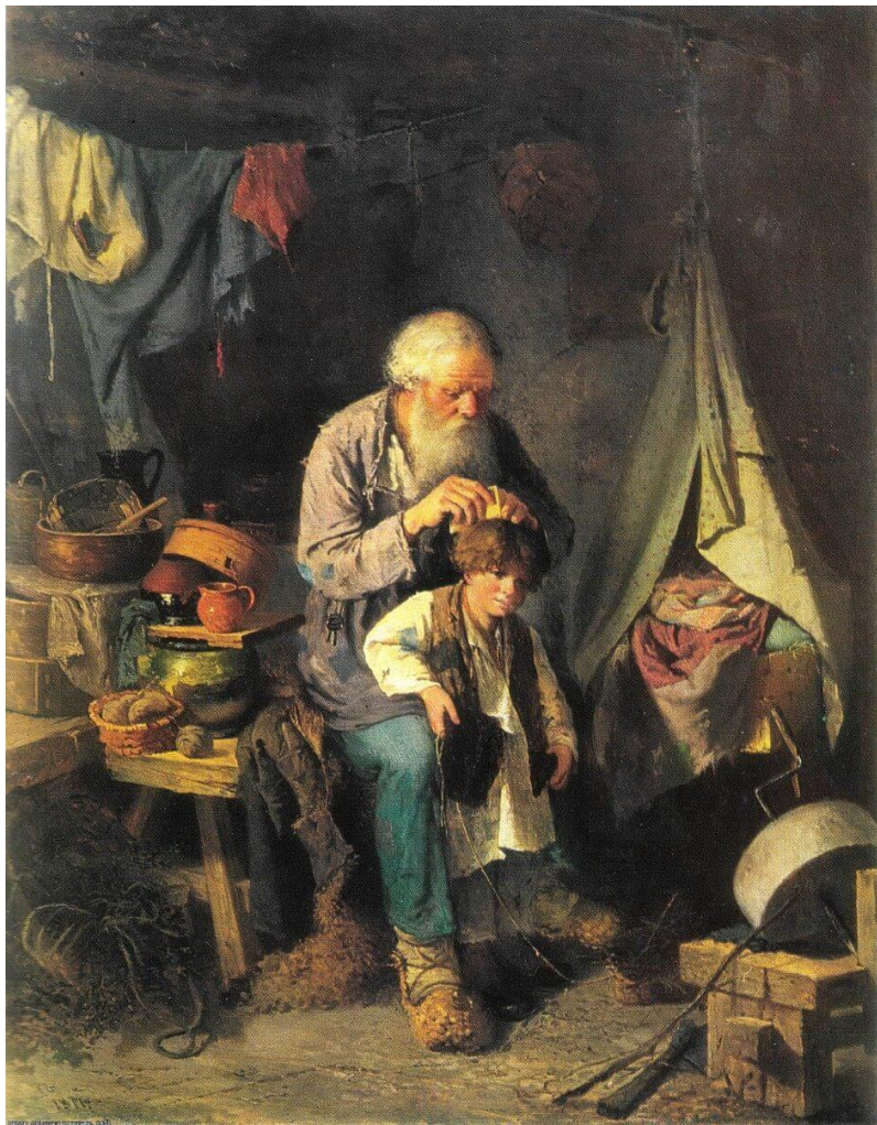
Дедушка и внучек. Василий Перов. 1871 год. Холст, масло