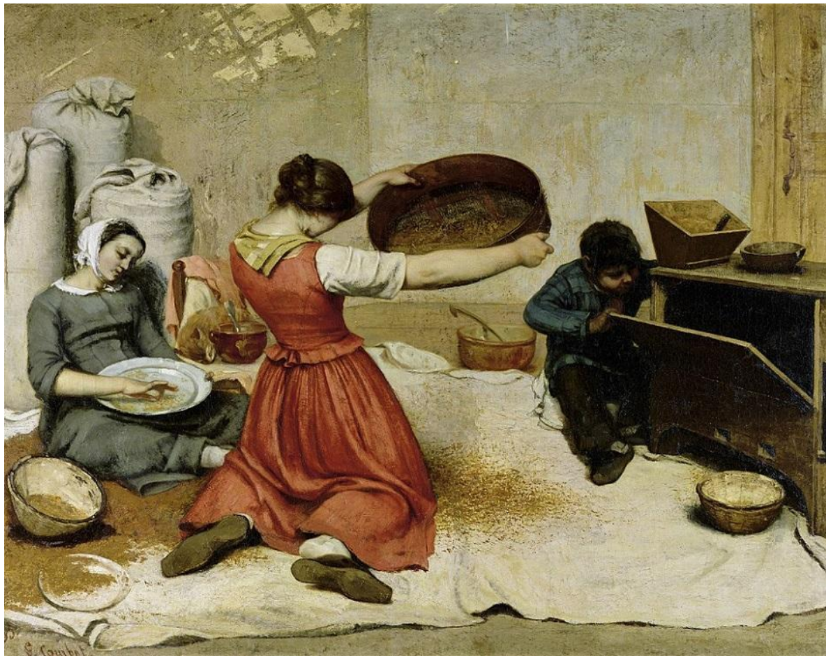
Реализм. Густав Курбе. Картина «Веяльщицы», 1853