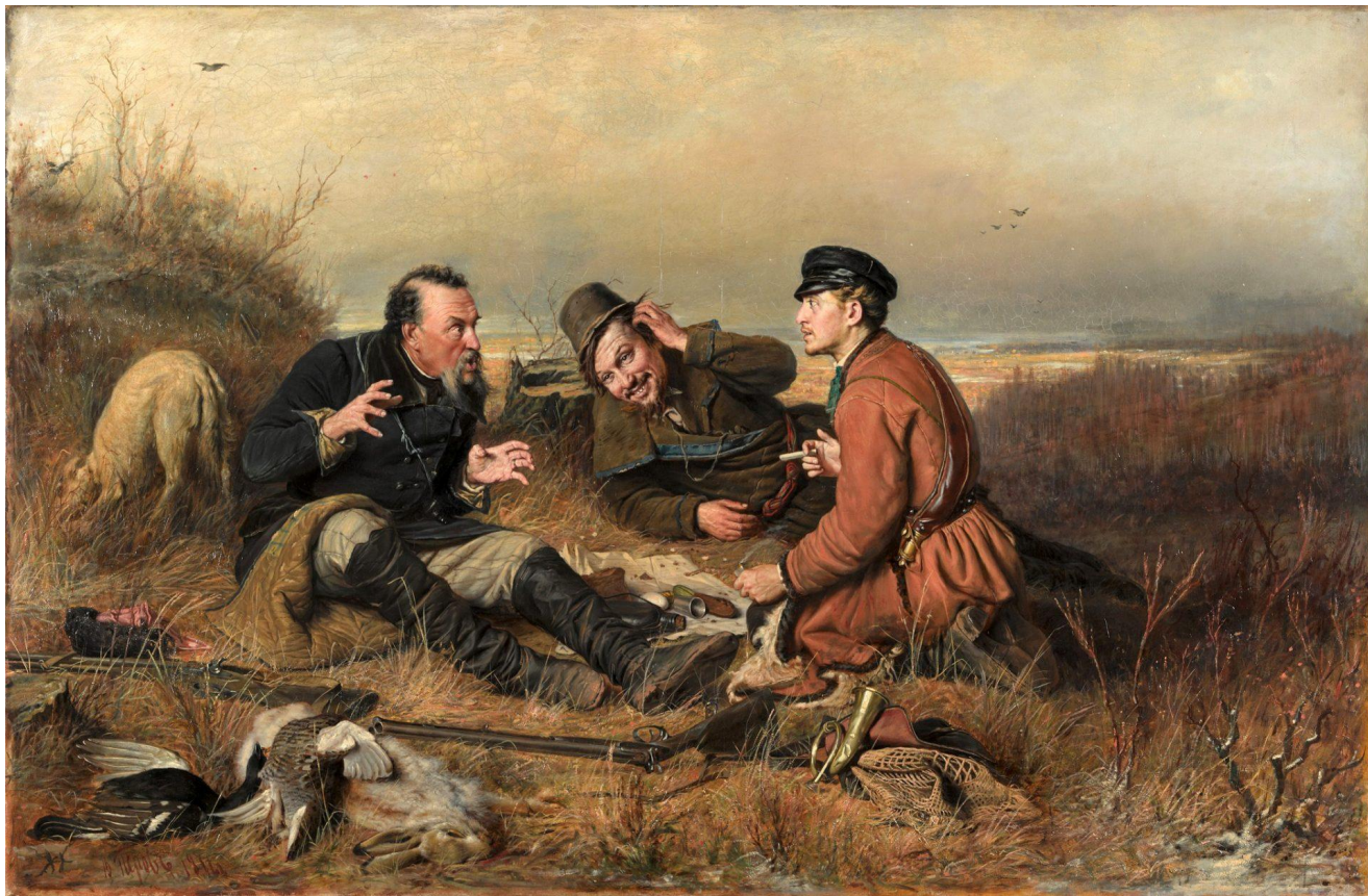
Охотники на привале. Василий Перов. 1871 год. Холст, масло