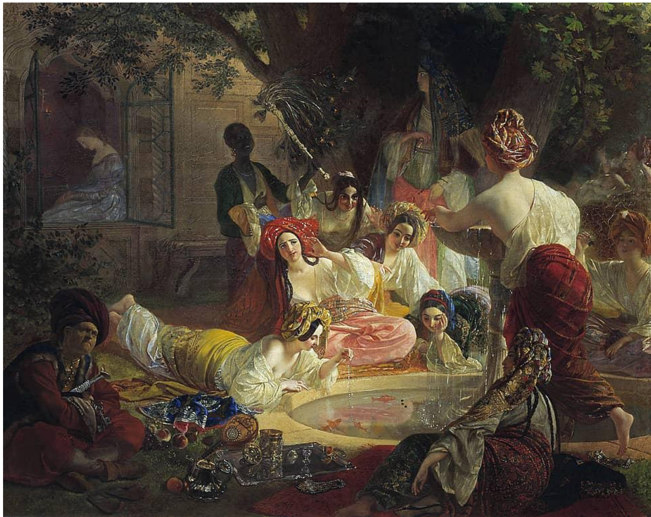
Бахчисарайский фонтан Автор: Карл Павлович Брюллов