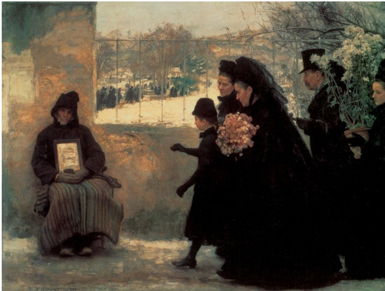
Натурализм. Эмиль Фриан. «День всех святых», 1888