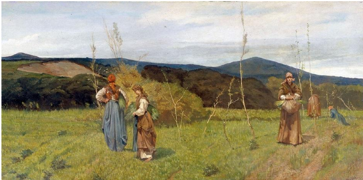
Реализм. Джованни Фаттори. Картина «Три крестьянина в поле», 1866-1867