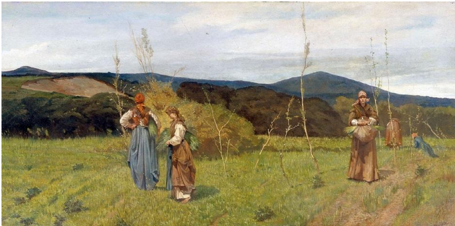
Реализм. Джованни Фаттори. Картина «Три крестьянина в поле», 1866-1867