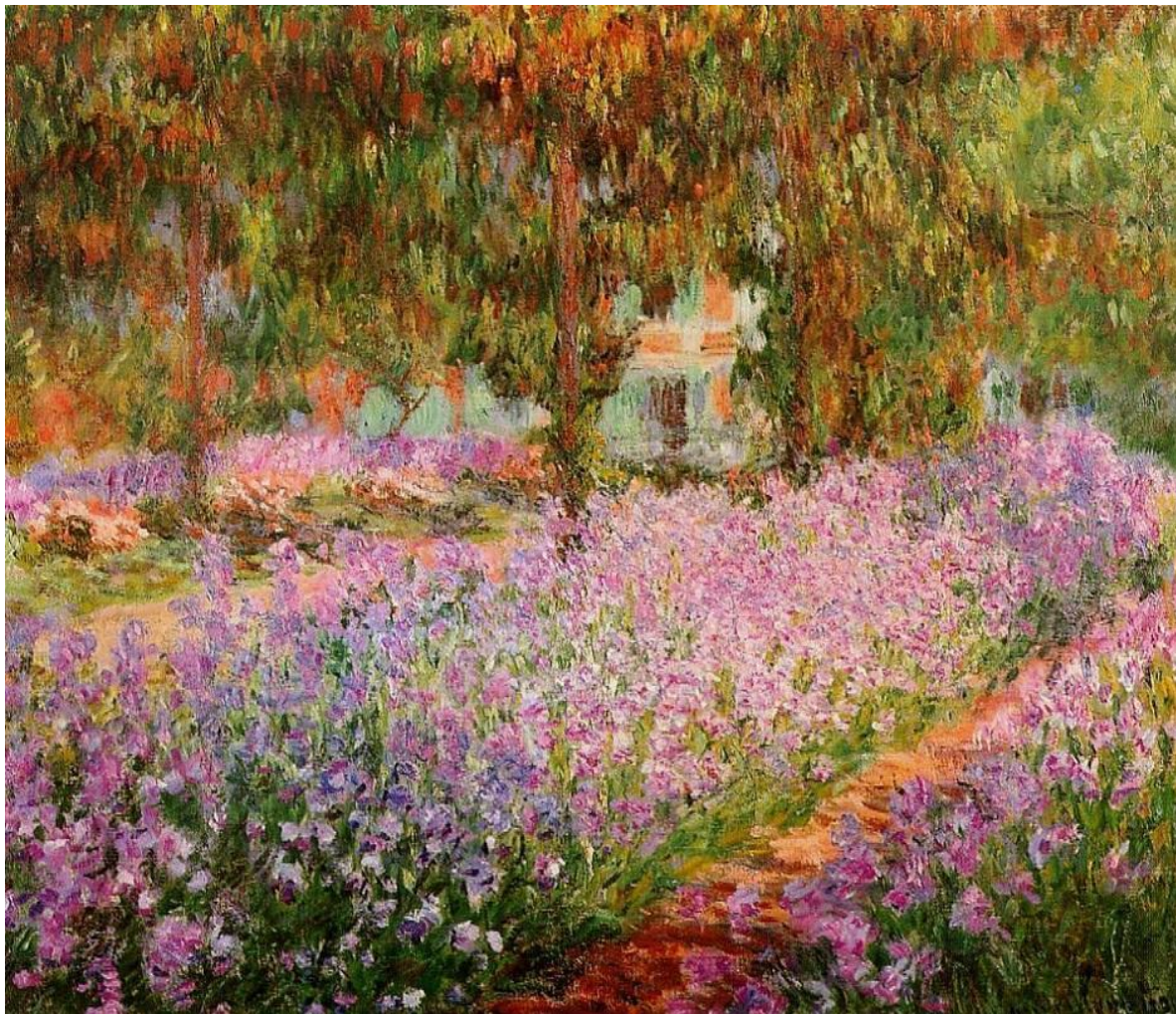
Импрессионизм. Клод Моне. «Ирисы в саду Моне»