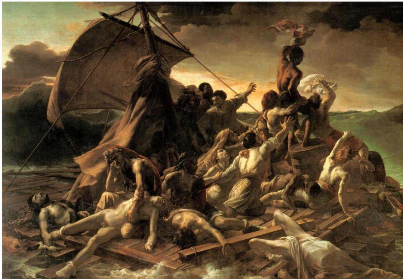
Романтизм. Теодор Жерико. «Плот “Медузы”»