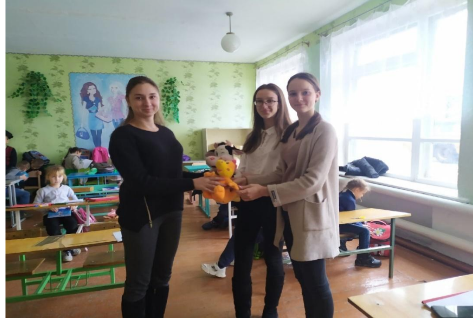
МОУ «Свободненская школа»