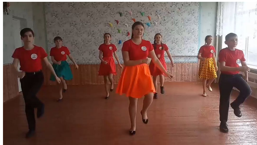
МОУ «Свободненская школа»