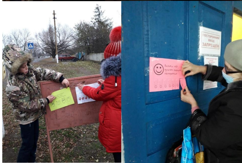
МОУ «Шевченковская школа»