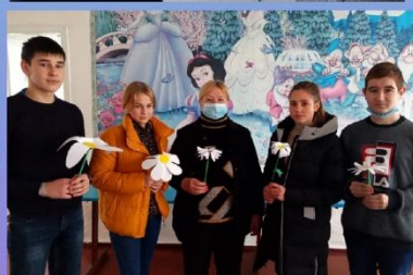
МОУ «Михайловская школа»