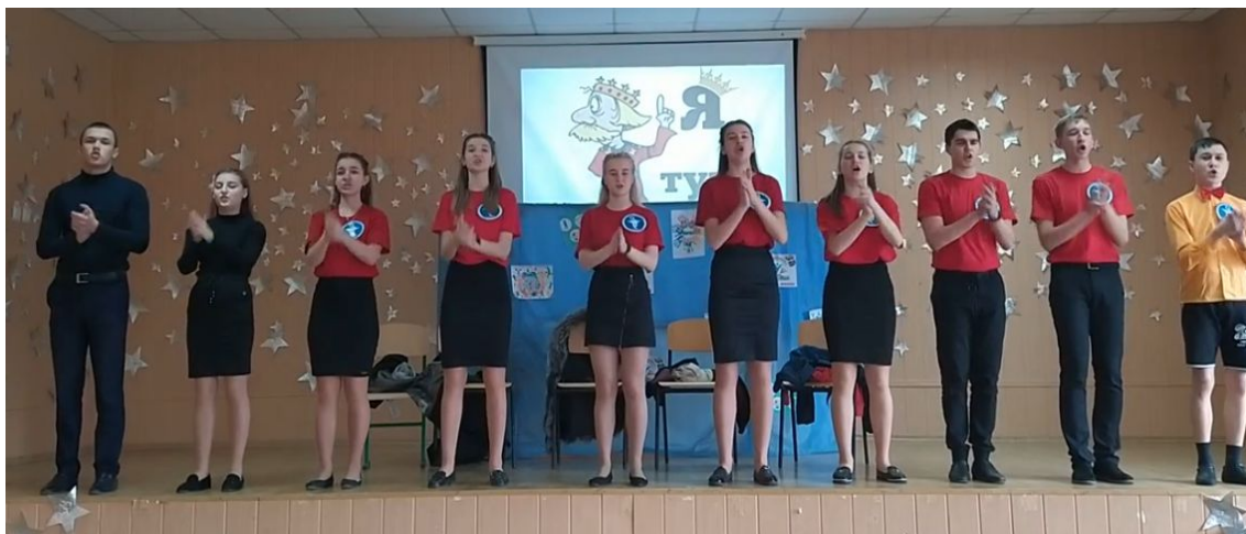
МОУ «Тельмановская гимназия»

23.03.2021 года прошел районный этап Республиканского конкурса агитбригад «Здоровое поколение Республики», который проводился с целью формирования у подрастающего поколения ценностного отношения к здоровому образу жизни