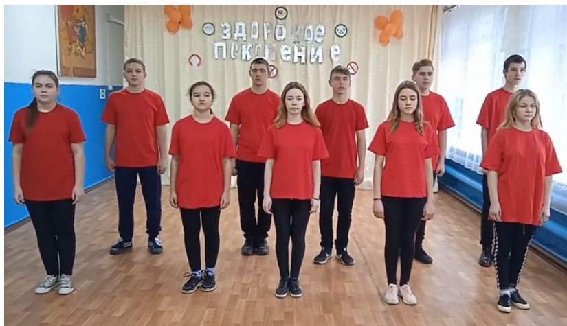
МОУ «Михайловская школа»