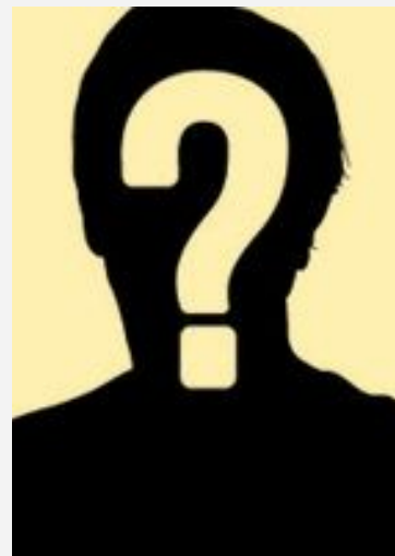
..... (Второй режиссер)