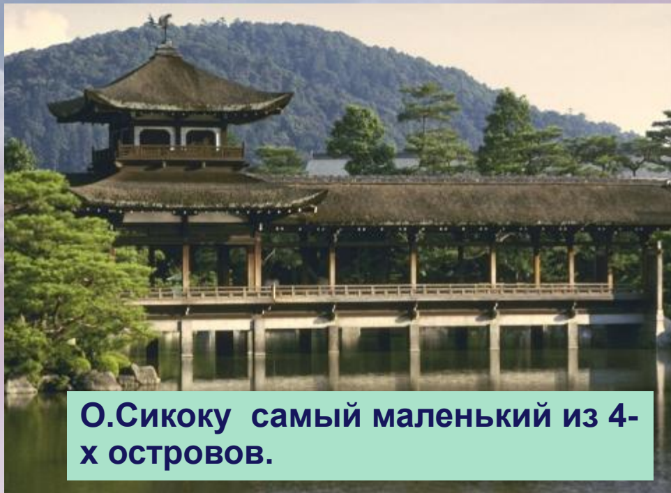
О.Сикоку самый маленький из 4-х островов.