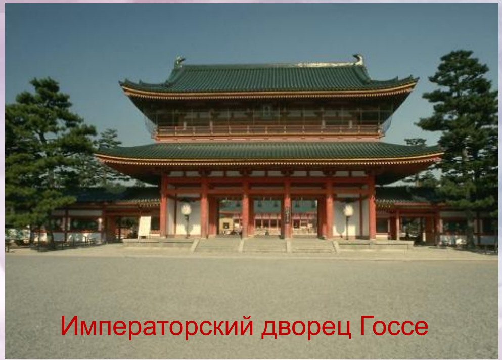
Императорский дворец Госсе