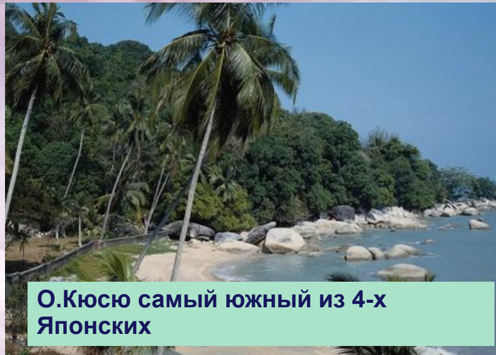
О.Кюсю самый южный из 4-х Японских