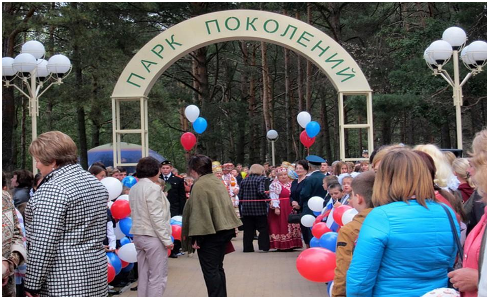
Парк поколений на Новостройке