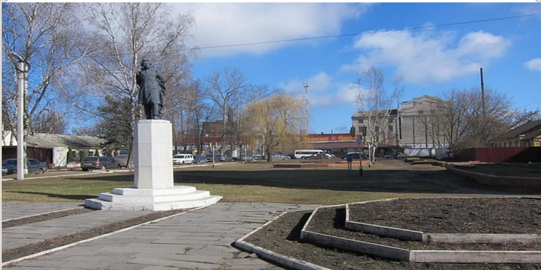
Сквер им.А.С. Пушкина