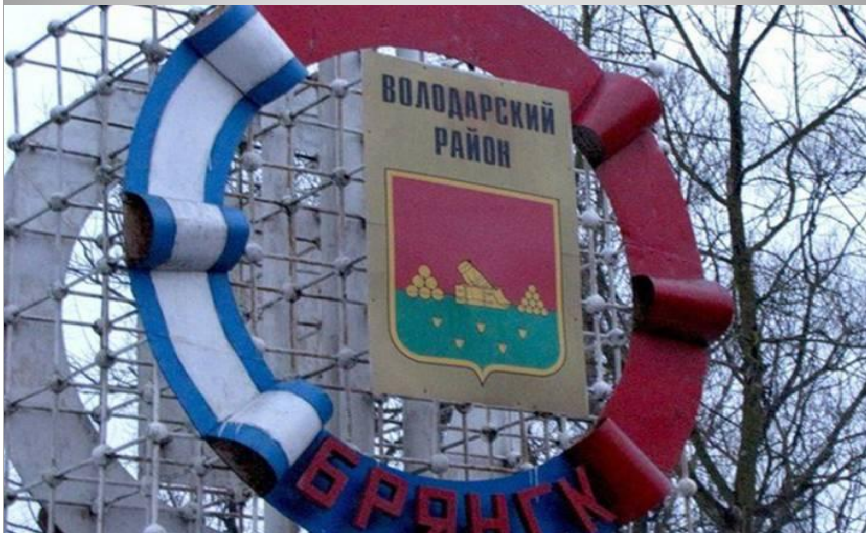
Герб Володарского района сегодня