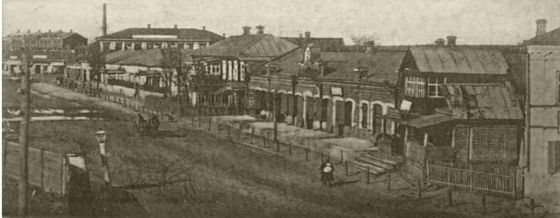
№ 27. г. Брянскъ. Видъ на привокзальную слободу съ моста.

С развитием железной дороги развивалась и Привокзальная слобода.