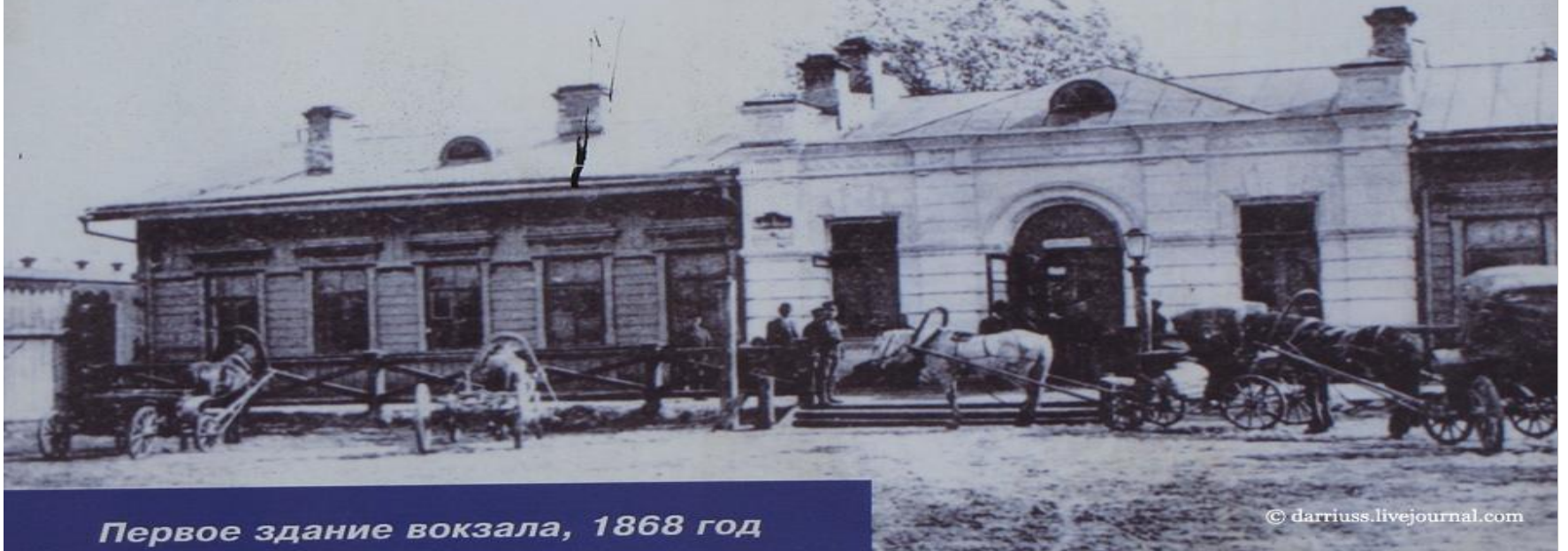
Первое здание вокзала, 1868 год

Брянскъ.—Briansk. № 12. Подъѣздъ станціи.