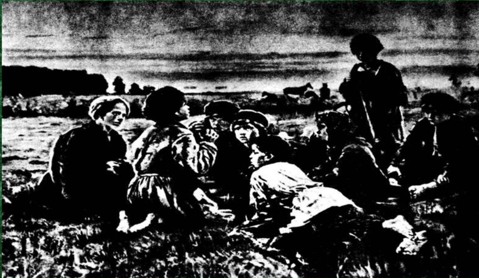
Ночное. В.А.Маковский. 1879