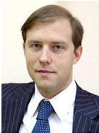
МАНТУРОВ Денис Валентинович

Родился 23 февраля 1969 года в г. Мурманске. Окончил МГУ им. М.В.Ломоносова, Российскую академию государственной службы при Президенте Российской Федерации. Указом Президента Российской Федерации от 21 мая 2012 года назначен Министром промышленности и торговли Российской Федерации.