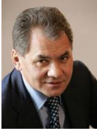
ШОЙГУ Сергей Кужугетович