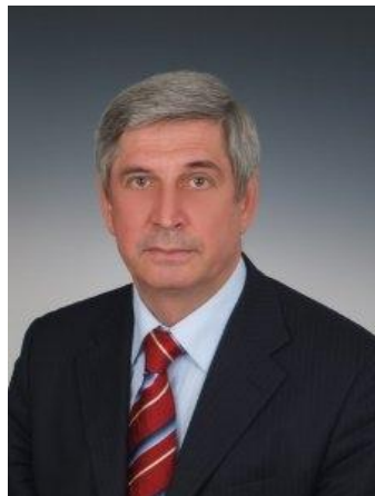
МЕЛЬНИКОВ Иван Иванович

Родился 8 августа 1950 года в г. Богородицке Тульской области. Окончил МГУ им. М.В.Ломоносова. Кандидат физико-математических наук, доктор педагогических наук, профессор. В январе 2012 года избран первым заместителем Председателя Государственной Думы Федерального Собрания Российской Федерации.