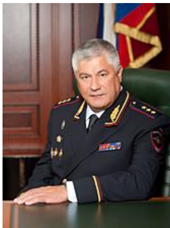
КОЛОКОЛЬЦЕВ Владимир Александрович

Министр внутренних дел Российской Федерации (заместитель председателя Комитета)