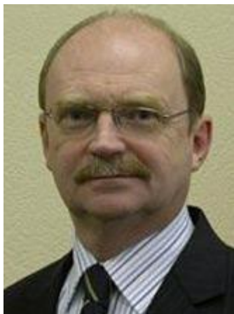
НАЗАРОВ Владимир Павлович

Родился 3 октября 1950 г. в г. Москве. В 1973 г. окончил факультет международных экономических отношений Московского государственного института международных отношений МИД СССР, в 1980 г. - Краснознаменный Институт КГБ СССР им. Ю. В. Андропова и в 1999 г.- Высшие курсы Военной Академии Генерального штаба Вооруженных Сил Российской Федерации. Кандидат политических наук. В августе 2006 года Указом Президента Российской Федерации назначен заместителем Секретаря Совета Безопасности Российской Федерации.