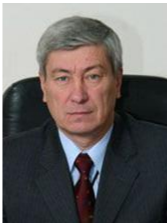
ЧИХАНЧИН Юрий Анатольевич

Родился 17 июня 1951 года в г. Красноярске. Окончил Сибирский технологический институт по специальности "инженер-технолог". Кандидат экономических наук. Распоряжением Правительства РФ от 22 мая 2008 года №725р назначен Директором Федеральной службы по финансовому мониторингу.