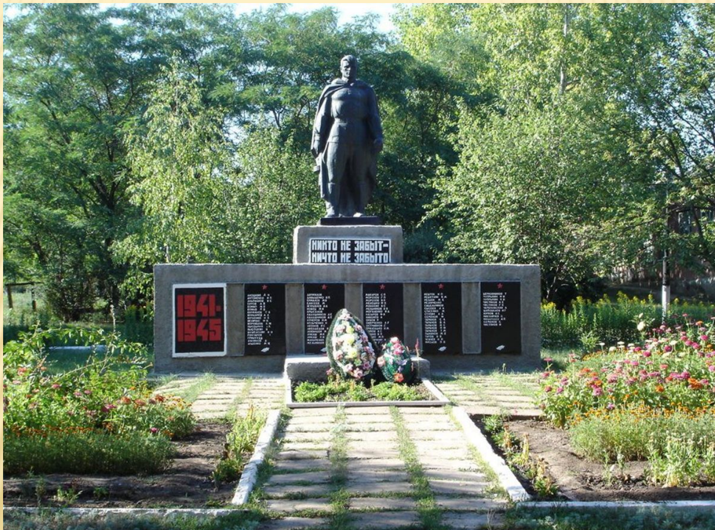
Памятник погибшим воинам. П.Теплые ключи

ИХ ИМЕНА ОСТАЛИСЬ НА ОБЕЛИСКАХ И В БЛАГОДАРНОЙ ПАМЯТИ ЗЕМЛЯКОВ.