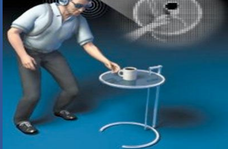
Очки для незрячих