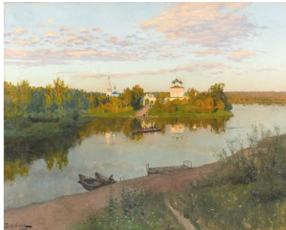
И.И. Левитан «Вечерний звон»