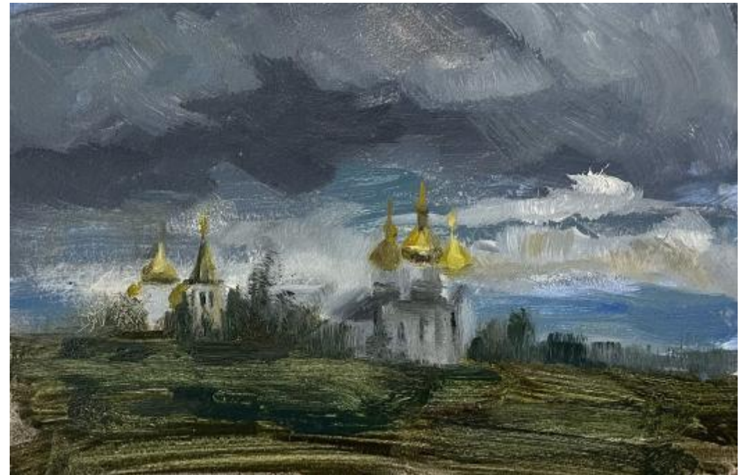
Пример выполненной работы