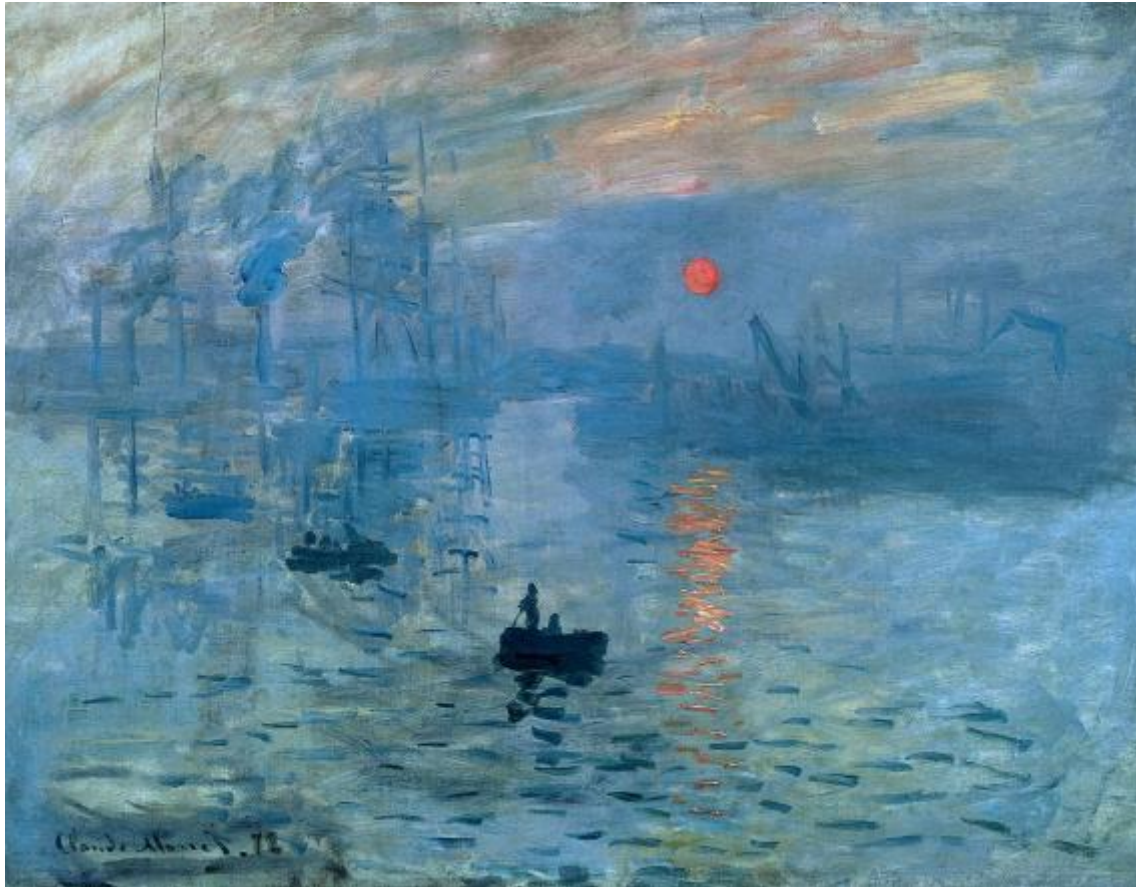
Клод Моне «Впечатление. Восходящее солнце»

В живописи, для художника, важным является передача своего отношения к изображенному. Живописный образ – одухотворенный, эмоциональный. Художник в пейзаже дает нам сумму авторских впечатлений и размышлений о природе.