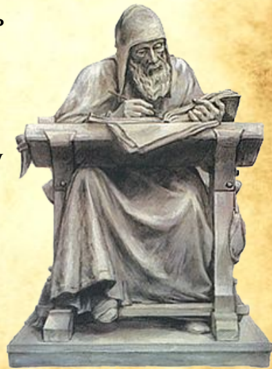
Нестор – літописець.

Особливу увагу серед інших східнослов'янських союзів племен Нестор-літописець приділяв полянам. За літописом, від них походили перші київські князі — брати Кий, Щек і Хорив, за яких почалося будівництво Києва. Це місто дістало назву на честь старшого з братів — Кия.