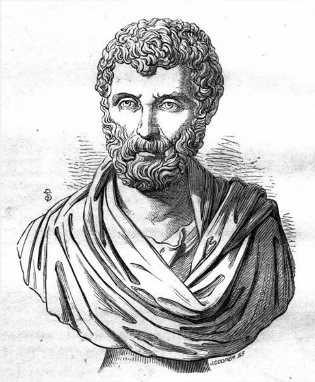
Геродот — древнегреческий историк

Геродот , считающийся родоначальником исторической науки, не просто описывал те или иные племена или сообщества, но и высказывал собственные замечания относительно соответствующего содержания. Например, в качестве отличительной черты некоторых сообществ он отмечал общность в них женщин. Например, у массагетов женщины были общим достоянием всех мужчин. Подтверждалось предположение Геродота о реальном существовании матриархальных отношений и группового брака