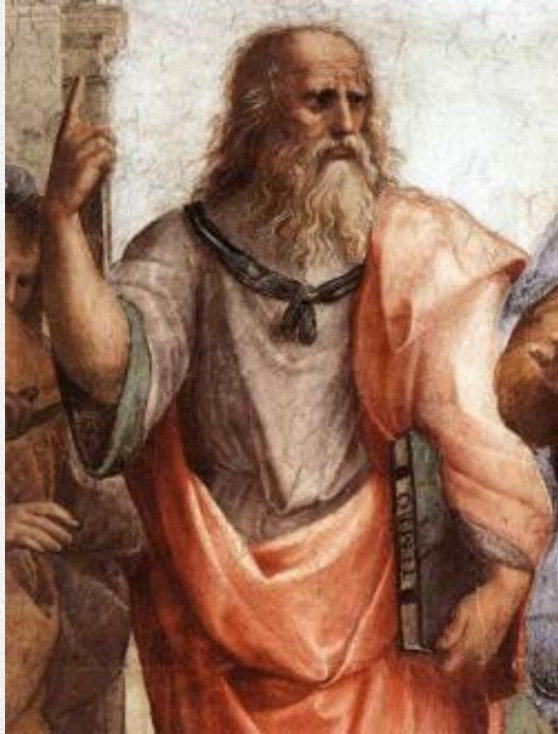
Платон — афинский философ классического периода Древней Греции

Платон первый попытался дать философское толкование возникновению любви, психологической близости мужчины и женщины.