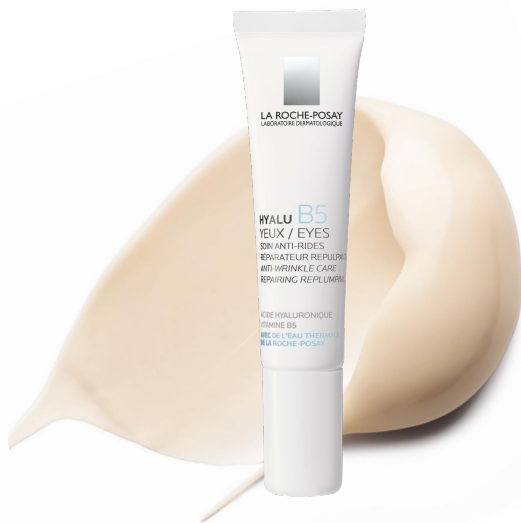
Гіалу Б5 Крем для шкіри навколо очей