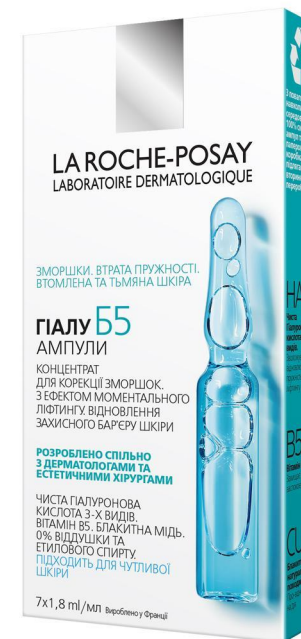
Додатковий догляд Гіалу Б5 Ампули Концентрат для корекції зморшок