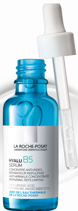
Гиалу Б5 Сыворотка

Дополните рутину средствами из линейки Гиалу Б5