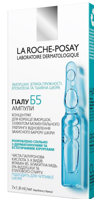
Дополнительный уход Гиалу Б5 Ампулы Концентрат для коррекции морщин