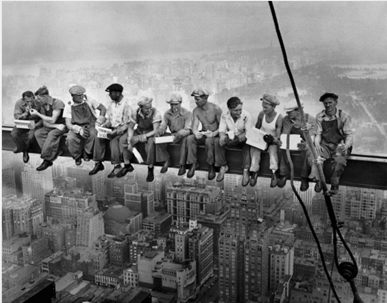
● Чарльз Эббетс, 1932г. «Lunch atop a Skyscraper» ●