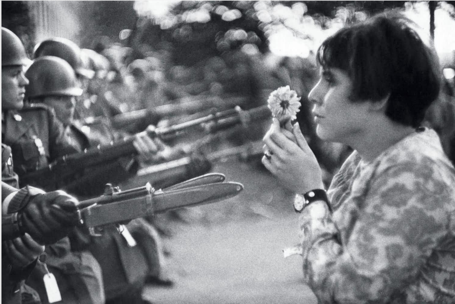
● Марк Рибо «Flower Power» 1967г. ●