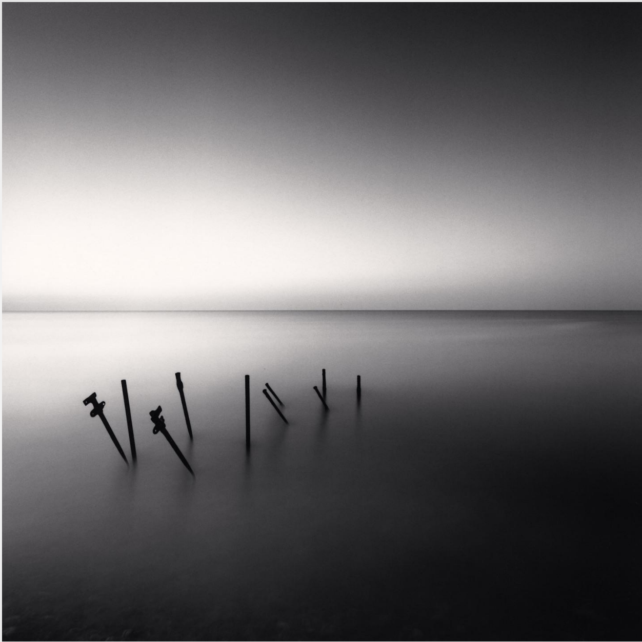
● Майкл Кенна ●