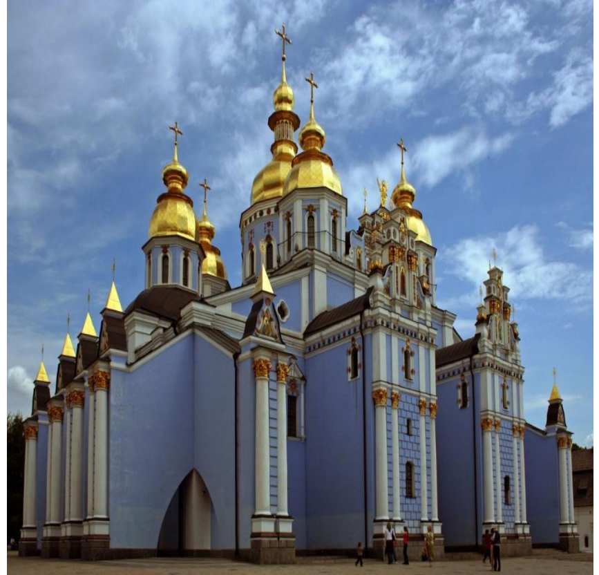
Михайловский собор. Город Киев

Собор имел огромное значение в жизни людей, вид его показывал могущество, славу города и его князя. И строить собор было делом княжеской чести, воплощением его гордых замыслов.