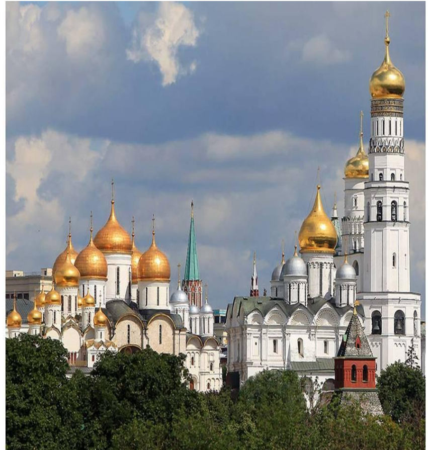
Спасский собор. Город Москва

В центре города на самом высоком и красивом месте, посреди большой площади строили собор – главный храм. Но также важное значение имело место перед главным собором — соборная площадь. Здесь проходили народные собрания, отсюда отправлялись войска в военные походы, здесь встречали и чествовали победителей, здесь зачитывались царские указы.