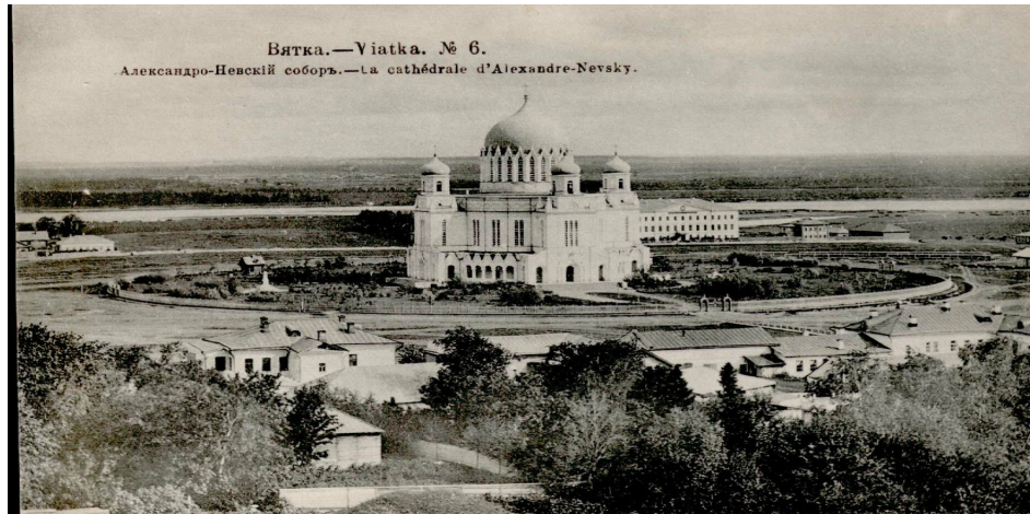
Александрo-Невскій соборъ в Вятке по проекту А. Л. Витберга закончен в 1864 г., уничтожен в 1937 г.