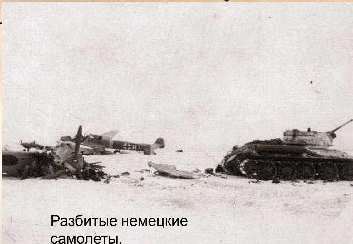
Разбитые немецкие самолеты.

Атака началась в 7.30 утра, после залпа дивизиона реактивной артиллерии по немецким позициям. Как констатирует «Отчет...», противник организовал оборону — но прочной она была только с севера, откуда он ждал удара. В результате 130-я танковая бригада вошла на аэродром уже к 9.00 транспорт