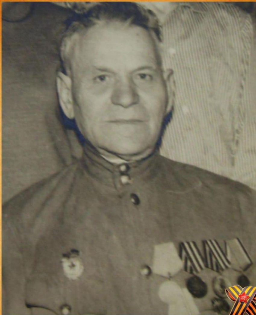
БОРОДИН АЛЕКСЕЙ ИЛЛАРИОНОВИЧ