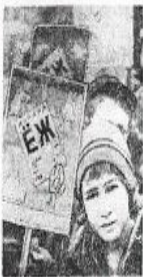
Книга — наш лучший товарищ и друг.

1. Пионеры-книгоноши. 2. Пополнение библиотек. 3. Борьба с плохой книгой. 4. Группы коллективного чтения книг.