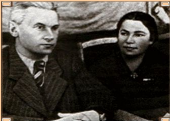
А. Фадеев и А. Барто на встрече с читателями 1945 год.