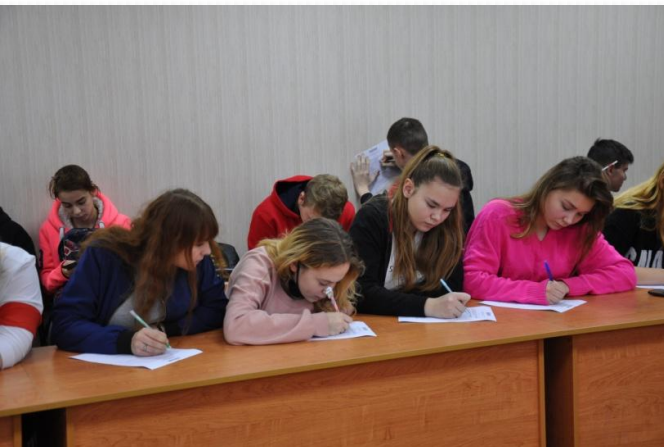
Фото мероприятий проекта Анкетирование «ЗОЖ и вредные привычки»