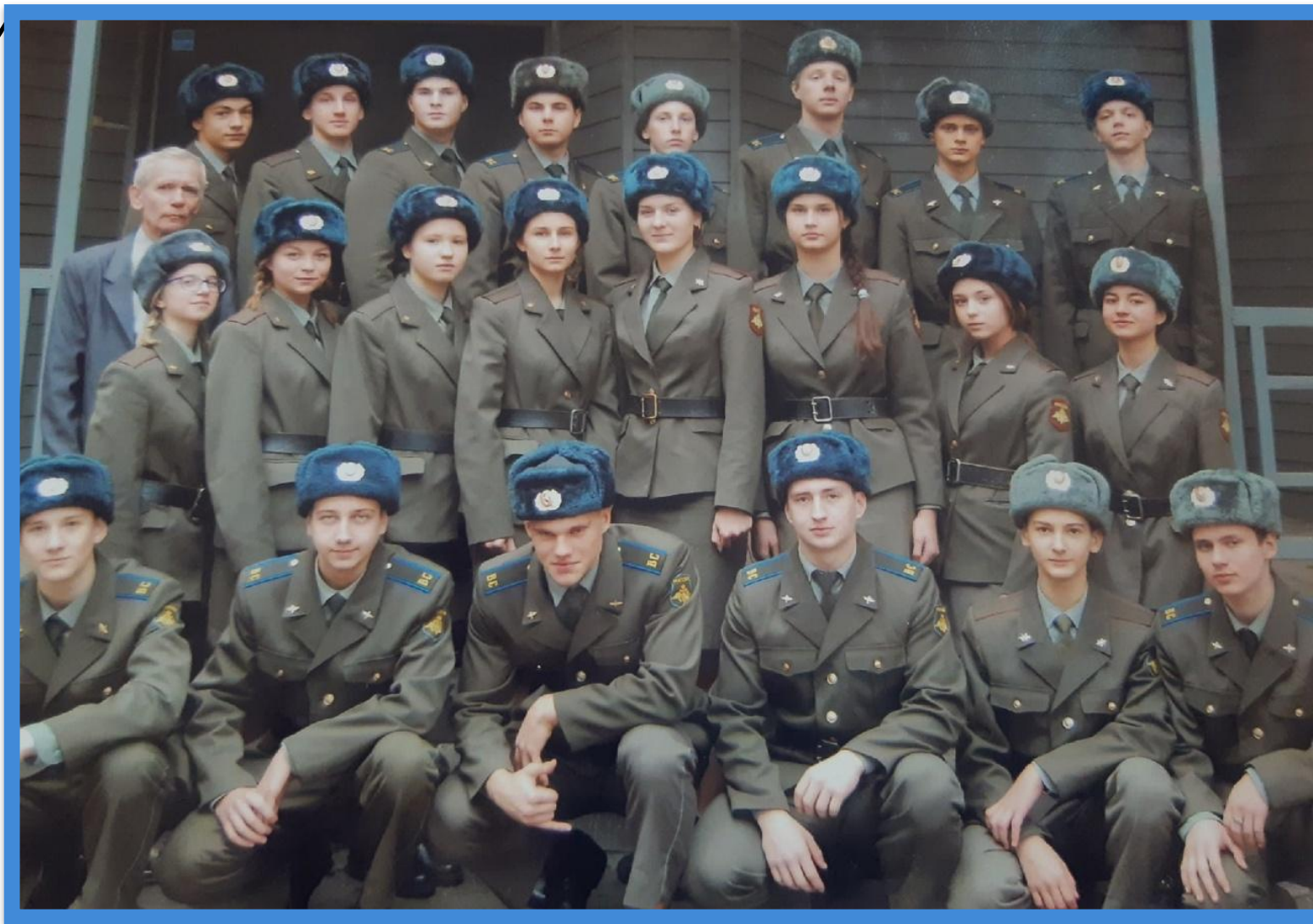
«Пост номер 1»