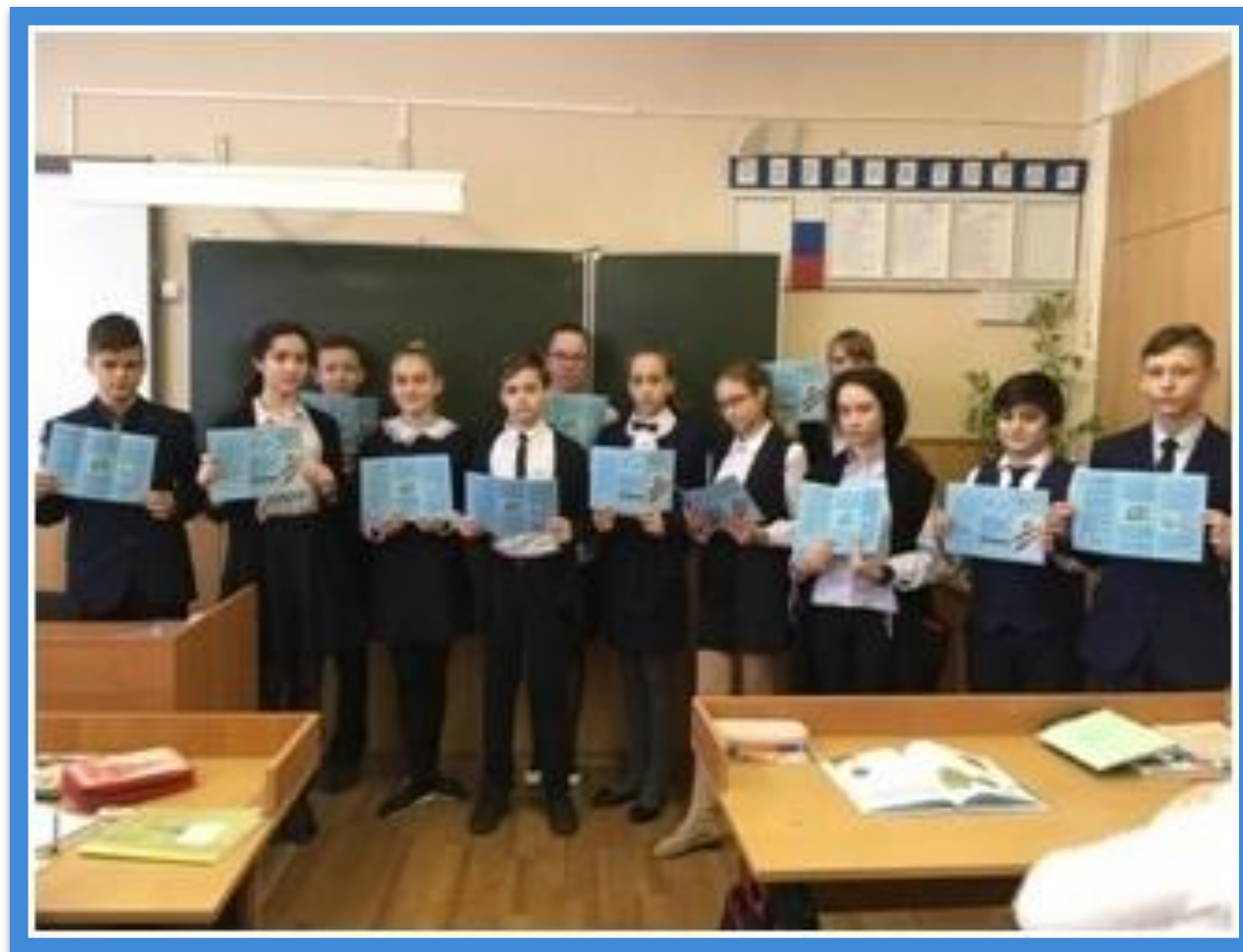
«Буклеты просвещения Здорового Образа Жизни»