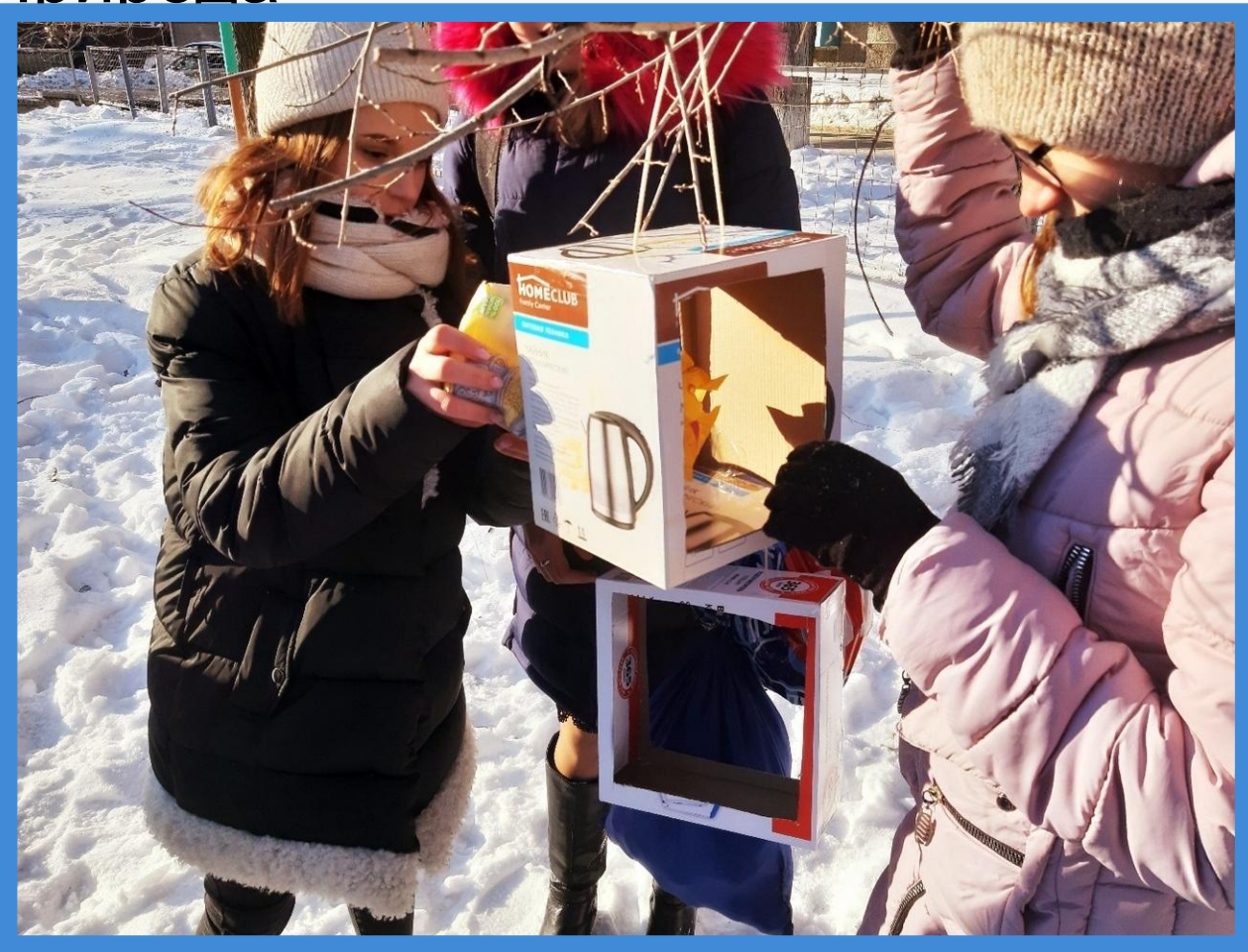
Кормушки для птиц